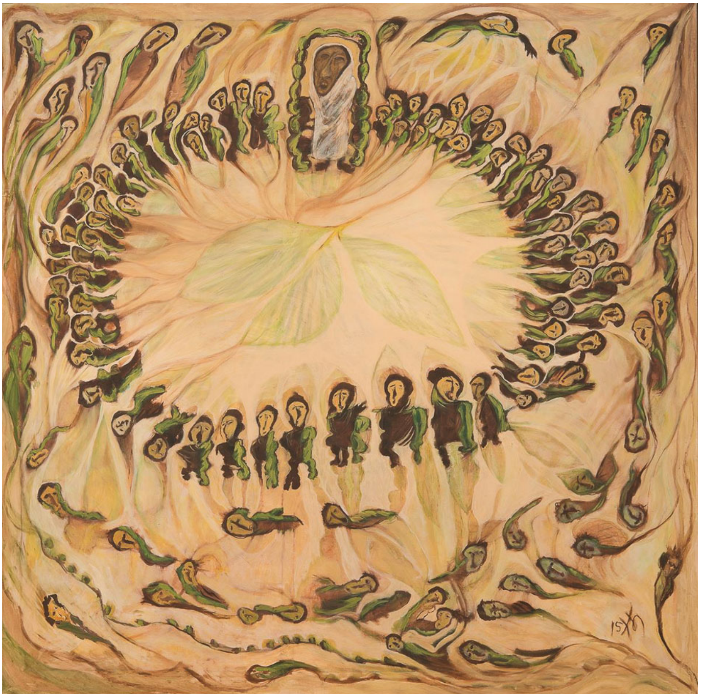
Kamala Ibrahim Ishaq (Sudan), Prozession (die Zār), 2015