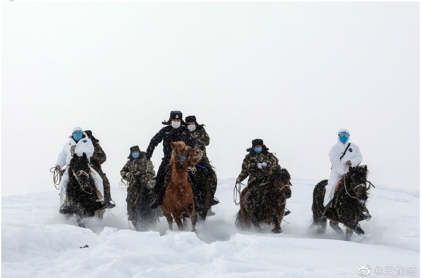
Chinesische Ärzt*innen im Altai-Gebirge.

Solle dies das Ende sein, verabschieden wir uns mit Würde, sollte es eine Übung sein lasst uns endlich beantragen, in Frieden zu leben.