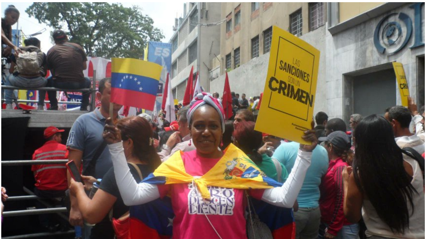
Sanktionen sind ein Verbrechen, Caracas, Venezuela, 2020.

Viele Jahrhunderte lang begegneten die Menschen Seuchen wie Cholera und Pest mit großer Trauer und nahmen die daraus katastrophalen Todesfolgen hin, ohne sie zu verstehen. Wenn die Katastrophen zuschlagen, sind es oft Frauen – in ihren Rollen als Pflegerinnen, Mütter, Schwestern – die die Gesellschaft zusammenhalten. Mysteriöse und mystische Erklärungen gibt es zur Genüge. Die Wissenschaft hat uns dabei geholfen, den Fatalismus zu überwinden, der die Menschen verwirrt hat; heute suchen wir in der Sequenzierung von Genen und in der Entwicklung von Impfstoffen nach Erklärungen. Es ist der Glaube an Verstand, Wissenschaft und Solidarität, der chinesische Mediziner*innen und Pfleger*innen in alle Ecken ihres Landes trieb, unter anderem ins Altai-Gebirge, um die Menschen dort zu heilen und dieses sehr gefährliche Virus einzudämmen, das uns in Angst und Schreck versetzt; dieser Glaube hat sie gemeinsam mit kubanischen Ärzt*innen in den Iran, den Irak und nach Italien getrieben, um den Ländern in Not zu helfen. Ihre Ankunft ruft uns die inzwischen einhundert Jahre währende Geschichte sozialistischer Ärzt*innen und Pfleger*innen in Erinnerung, die sich um der Menschheit Willen in die internationale Solidarität gestürzt haben. Diese Menschen teilen die ethische Weltsicht der kommunistischen Ärzt*innen Indiens und deren Volkspolikliniken, über die wir im Dossier Nr. 25 (Februar 2020) geschrieben haben. Dies ist die sozialistische Tradition.