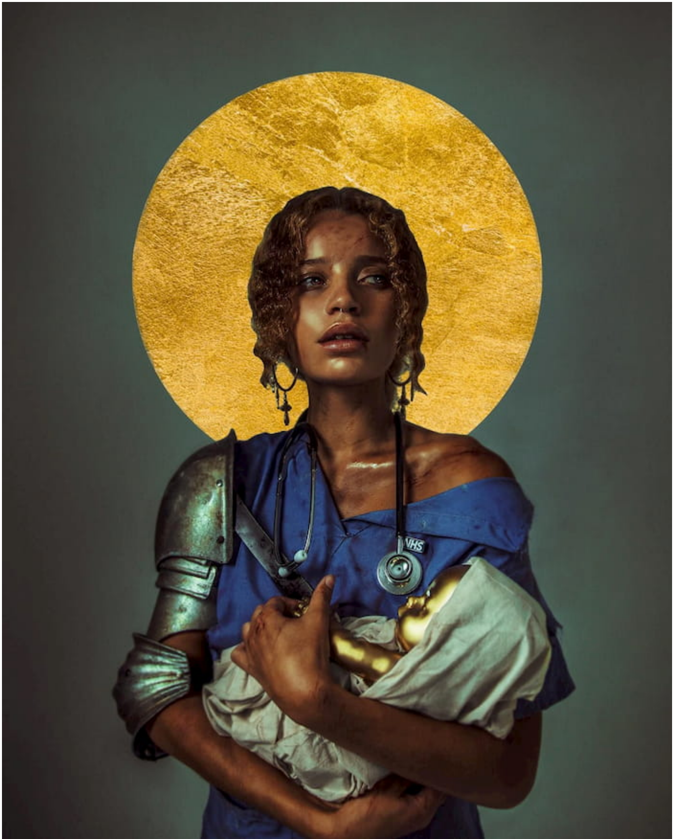
Haris Nukem, Counting Blessings, 2019.