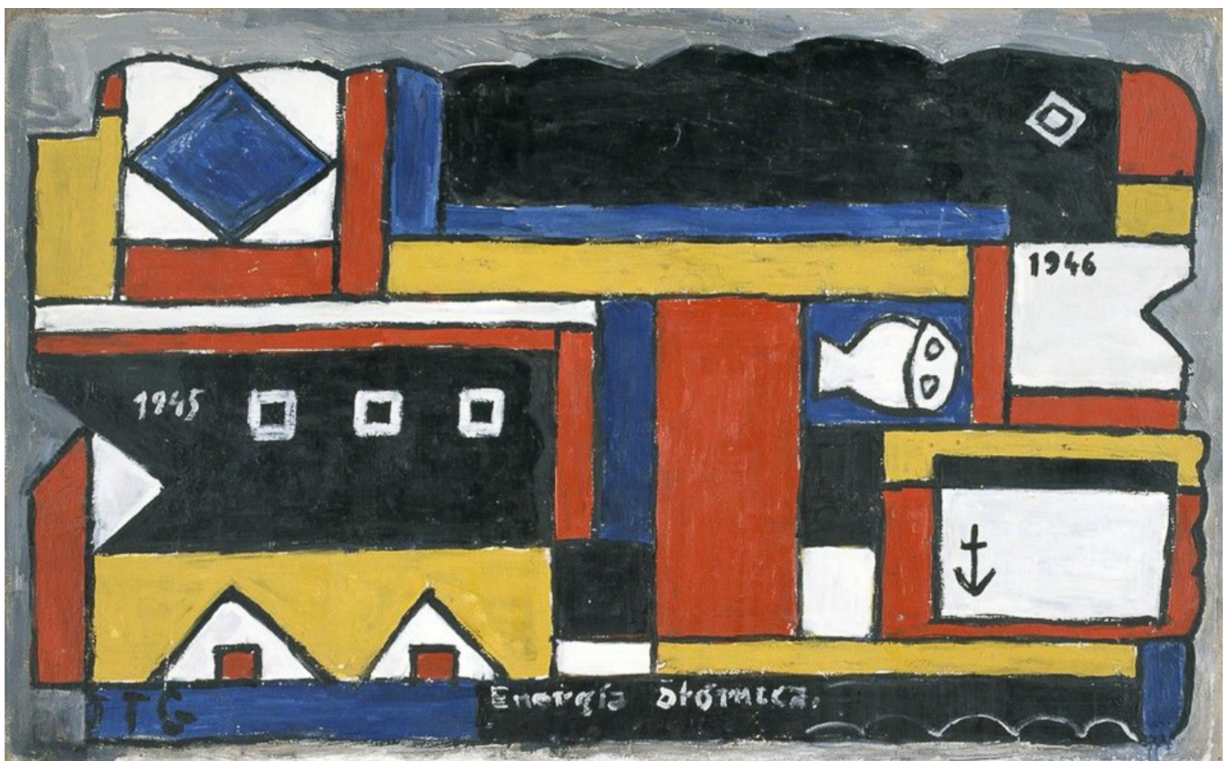
Joaquín Torres García (Uruguay), Energía Atómica, 1946.

En mayo de 2020, la OMS propuso establecer un ensayo solidario internacional de la vacuna contra la covid-19, en el que dicha organización coordinaría los centros de ensayo en diversos países. Esto hubiera permitido que candidatas a vacunas emergentes pudieran entrar más rápida y transparentemente a las pruebas clínicas, y que se ensayaran en poblaciones diversas para poder hacer comparaciones de fortalezas y debilidades específicas. Las compañías farmacéuticas multinacionales y los países del Norte Global sofocaron esta propuesta.