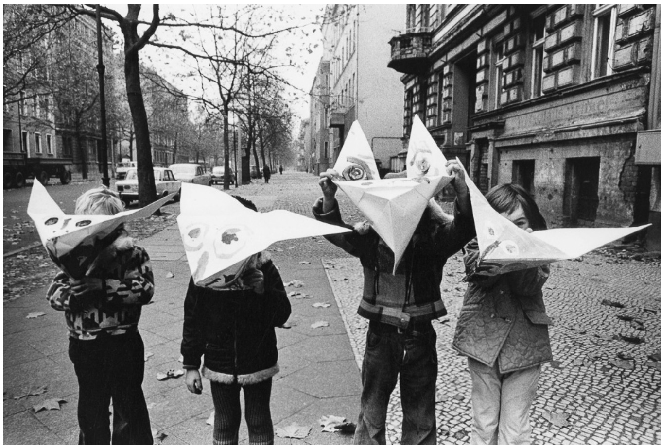
Roger Melis (RDA), Kinder in der Kollwitzstraße [Niños en Kollwitzstraße], 1974.

No todas las infecciones pueden prevenirse con vacunas. A pesar de las grandes inversiones financieras, todavía no tenemos (y puede que nunca tengamos) vacunas confiables para ciertas enfermedades contagiosas —como el VIH y la malaria— debido a la complejidad biológica de estas enfermedades. Ha sido posible acelerar la elaboración de las vacunas contra la covid-19 porque la mayoría de ellas se basan en mecanismos biológicos bien comprendidos en una enfermedad menos compleja. Las vacunas son una medida importante para contener las epidemias infecciosas. Sin embargo, los cambios genéticos en el microbio infeccioso pueden hacer que las vacunas sean inefectivas y se necesiten desarrollar y desplegar nuevas vacunas.