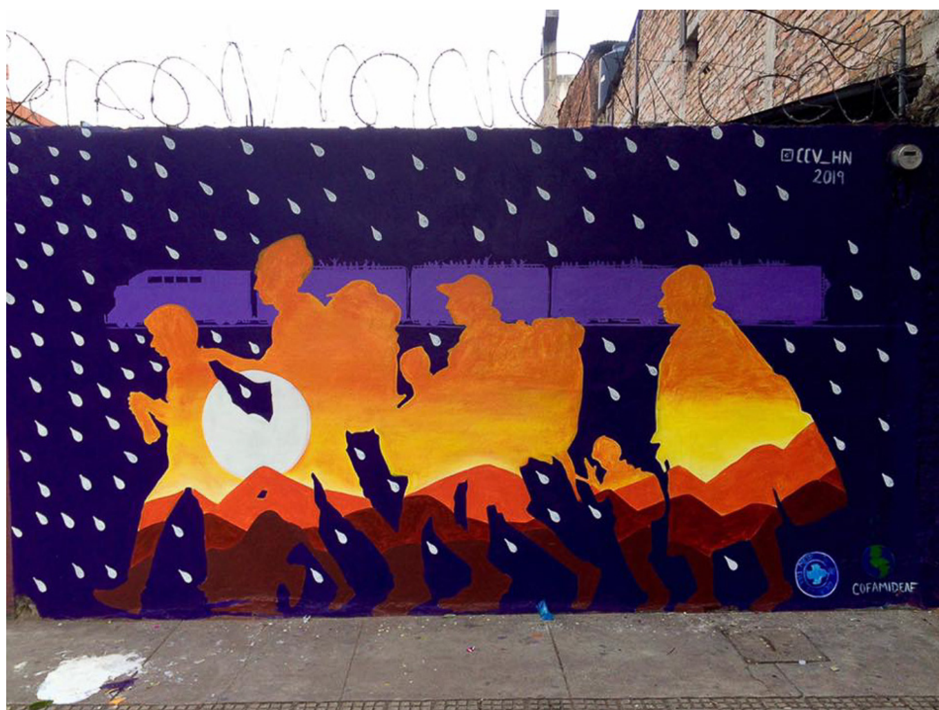
Colectivo Culturas Vivas, Senderos latinos , Honduras, 2019