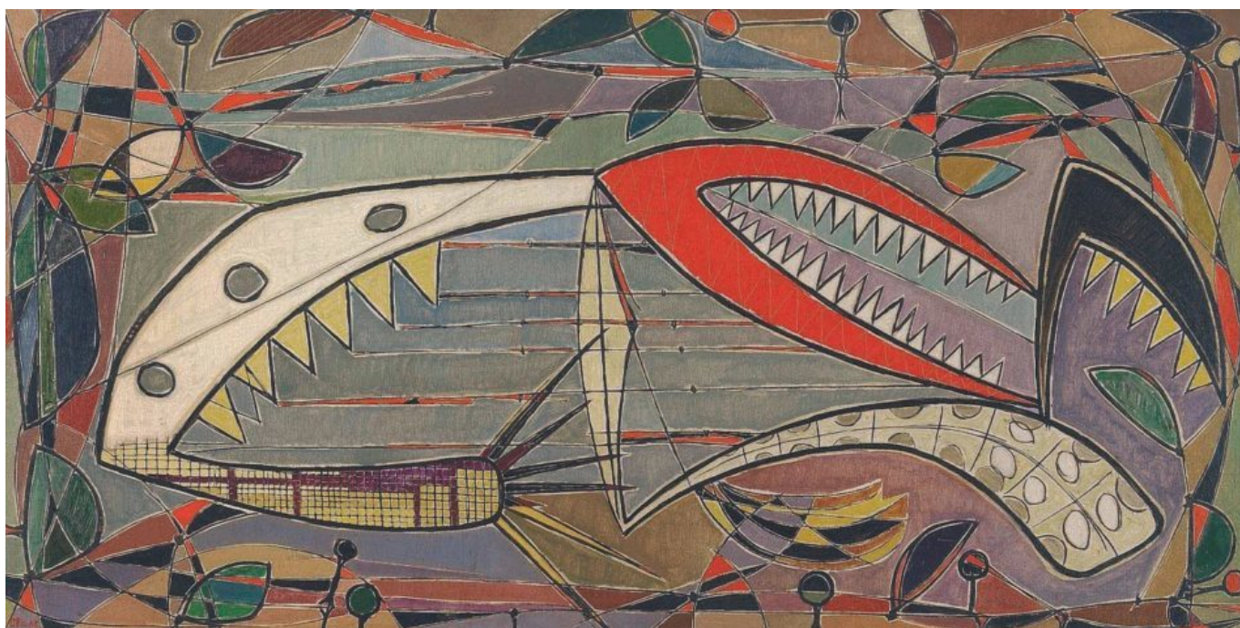
Oswaldo Vigas (Venezuela), Alacrán , 1952.

Con la nueva Constitución, el antiguo Tribunal Supremo de Venezuela —que la oligarquía del país había utilizado como mecanismo para impedir que se produjeran cambios sociales importantes— fue sustituido por el Tribunal Supremo de Justicia (TSJ). A lo largo del último cuarto de siglo, el TSJ se ha visto perturbado por varias controversias, en gran parte derivadas de intervenciones de la vieja oligarquía, que se negó a aceptar los grandes cambios que Chávez impulsó en sus primeros años. De hecho, en 2002, los jueces del TSJ absolvieron a los líderes militares que intentaron dar un golpe de Estado contra Chávez, un acto que indignó a la mayoría de las y los venezolanos. Esta injerencia continuada acabó provocando la ampliación de la magistratura (como había hecho el presidente estadounidense Franklin D. Roosevelt en 1937 por motivos similares), así como un mayor control legislativo sobre el poder judicial, como existe en la mayoría de las sociedades modernas (como en Estados Unidos, donde la supervisión de los tribunales por parte del Congreso está institucionalizada a través de instrumentos como la “cláusula de excepciones”). No obstante, este conflicto sobre el TSJ proporcionó un arma temprana a Washington y a la oligarquía venezolana en su intento de deslegitimar al gobierno de Chávez.