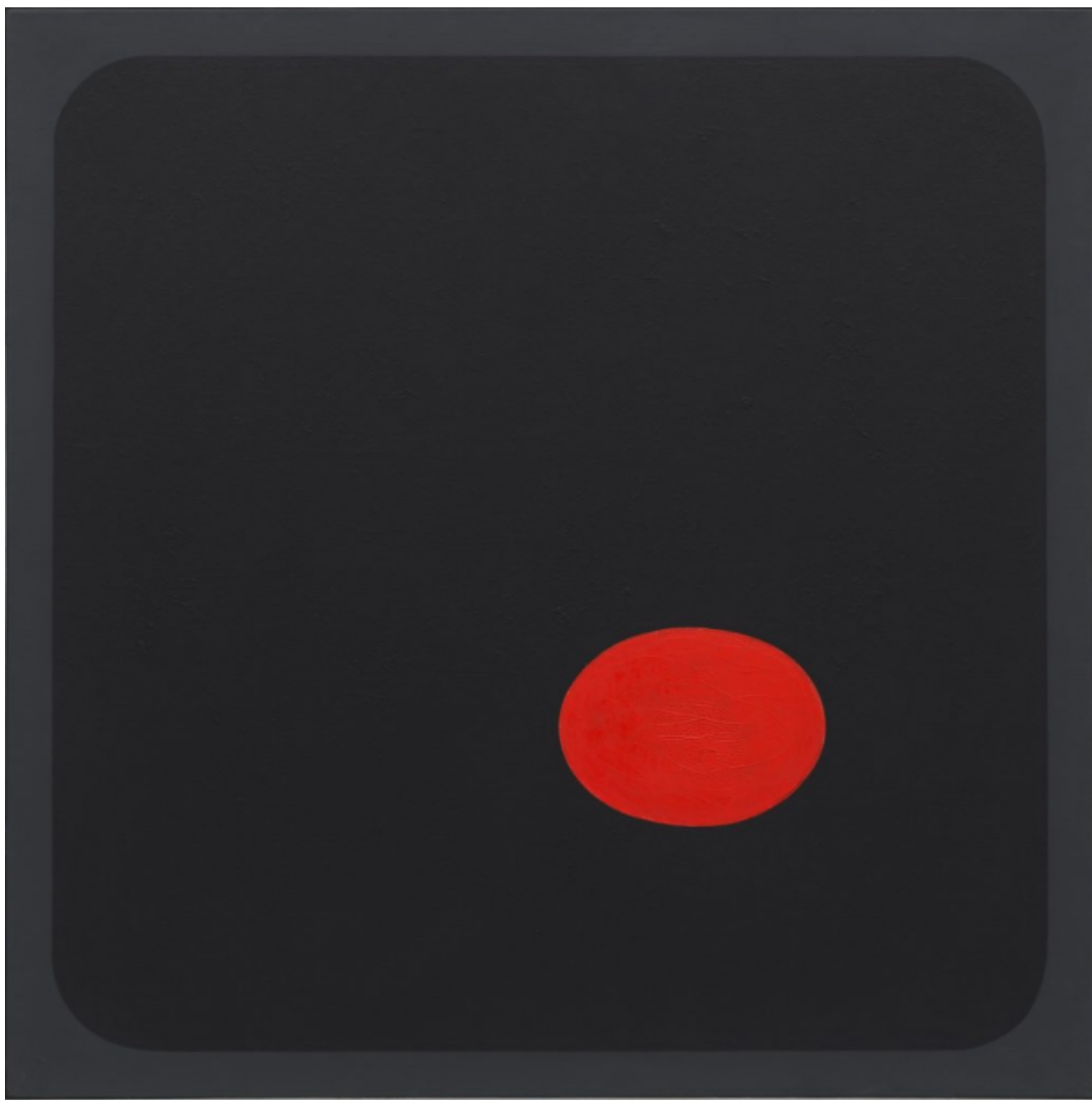
Elsa Gramcko (Venezuela), R-33 Todo comienza aqui , 1960.

La Carta de las Naciones Unidas (1945) permite al Consejo de Seguridad autorizar sanciones en virtud del artículo 41 del capítulo VII. Sin embargo, subraya que estas sanciones solo pueden aplicarse mediante una resolución del Consejo de Seguridad de la ONU. Por ello, las sanciones de Estados Unidos a Venezuela, que se impusieron por primera vez en 2005 y se han profundizado desde 2015, son ilegales. Como señaló en su informe de 2022 la relatora especial de la ONU sobre medidas coercitivas unilaterales, Alena F. Douhan, estas medidas unilaterales son propensas al sobrecumplimiento y a las sanciones secundarias como resultado del miedo de los países y las empresas a ser castigados por Estados Unidos. Las medidas ilegales impuestas por EE.UU. han provocado pérdidas de decenas de miles de millones de dólares desde 2015 y han servido como castigo colectivo contra la población venezolana ( forzando a más de seis millones de personas a abandonar el