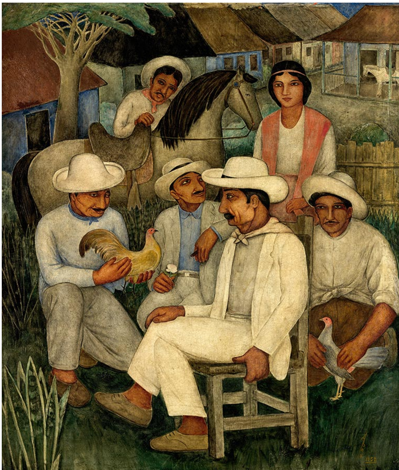
Eduardo Abela (Cuba), Los Guajiros (1938).

En 1804, la Revolución Haitiana —una rebelión del proletariado de las plantaciones que luchó contra los