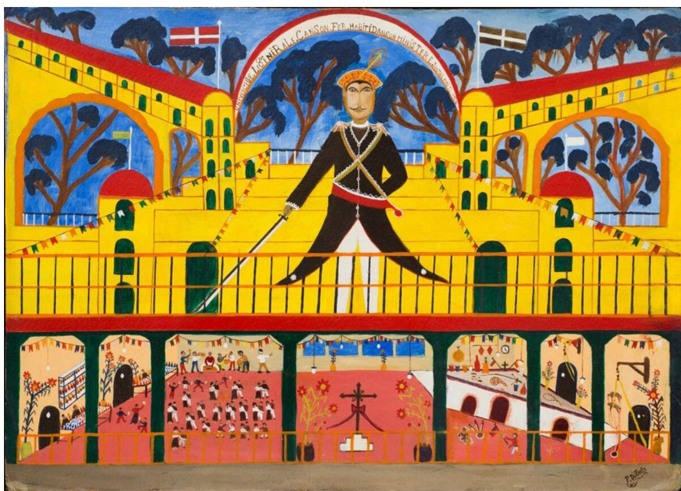
Préfète Duffaut (Haití), Le Générale Canson ('El general Canson'), 1950.