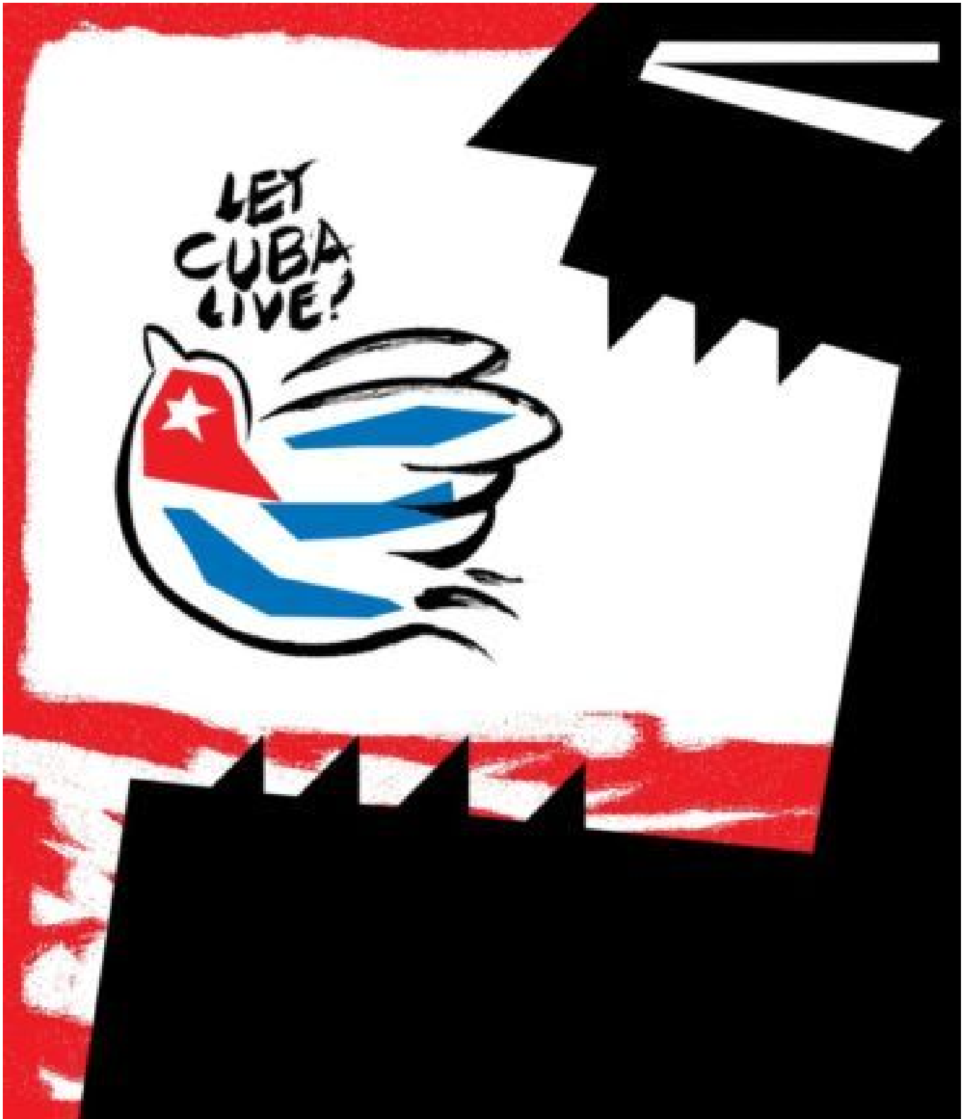
Uttam Ghosh (India), Let Cuba Live ('Dejemos a Cuba vivir'), 2021.