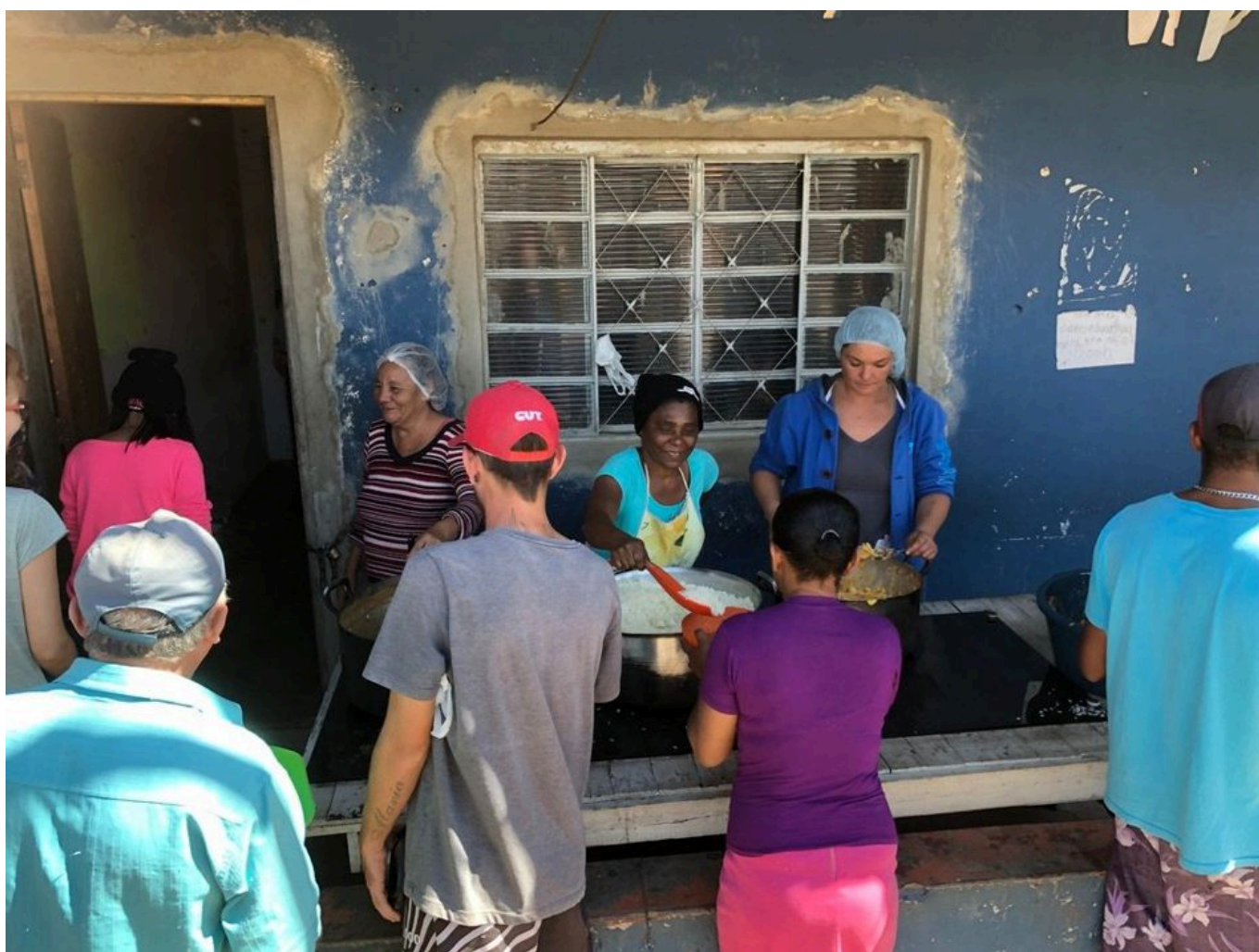
Cocina comunitaria en el Campamento Marielle Vive, 2019.

Al centro del campamento está la cocina comunitaria, donde algunxs pobladorxs comen sus tres comidas cada día. La alimentación es simple pero nutritiva. Cerca hay un pequeño centro de salud al que va un médico una vez por semana. Afuera de las casas hay jardines con flores y huertas con vegetales. Las autoridades municipales de la ciudad vecina dejaron de permitir que el autobús escolar recogiera a los y las niñas del campamento y los llevara a la escuela local. Como era un gran esfuerzo para madres y padres transportar a sus hijxs hacia y desde el colegio todos los días, el campamento construyó ahí mismo una sala de clases para actividades extraescolares, que ha seguido funcionando durante la pandemia.