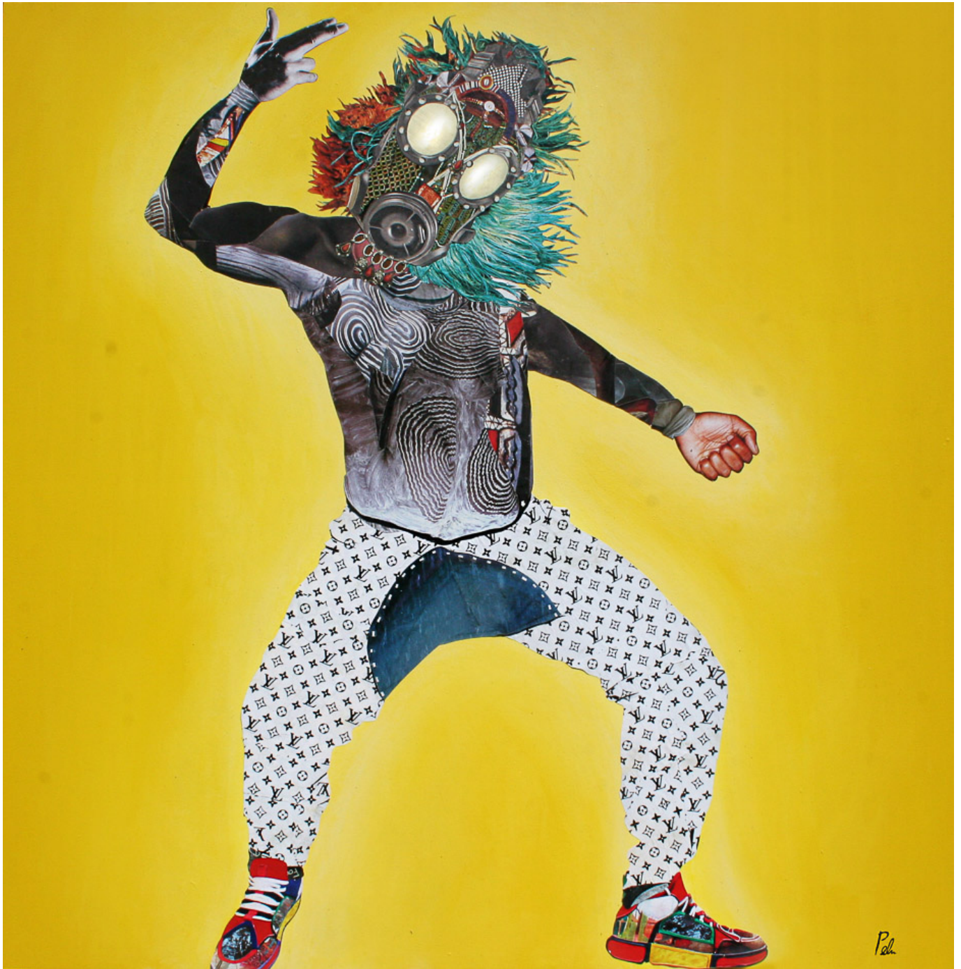
Penda Diakité (Mali), Bouana (2019).

base colonial de Tessalit (Mali), mientras EE. UU. construía la base de drones más grande del mundo en Agadez (Níger). Construyeron un muro por todo el Sahel —al sur del Sahara— como la frontera efectiva del sur de Europa, comprometiendo la soberanía de los países africanos.