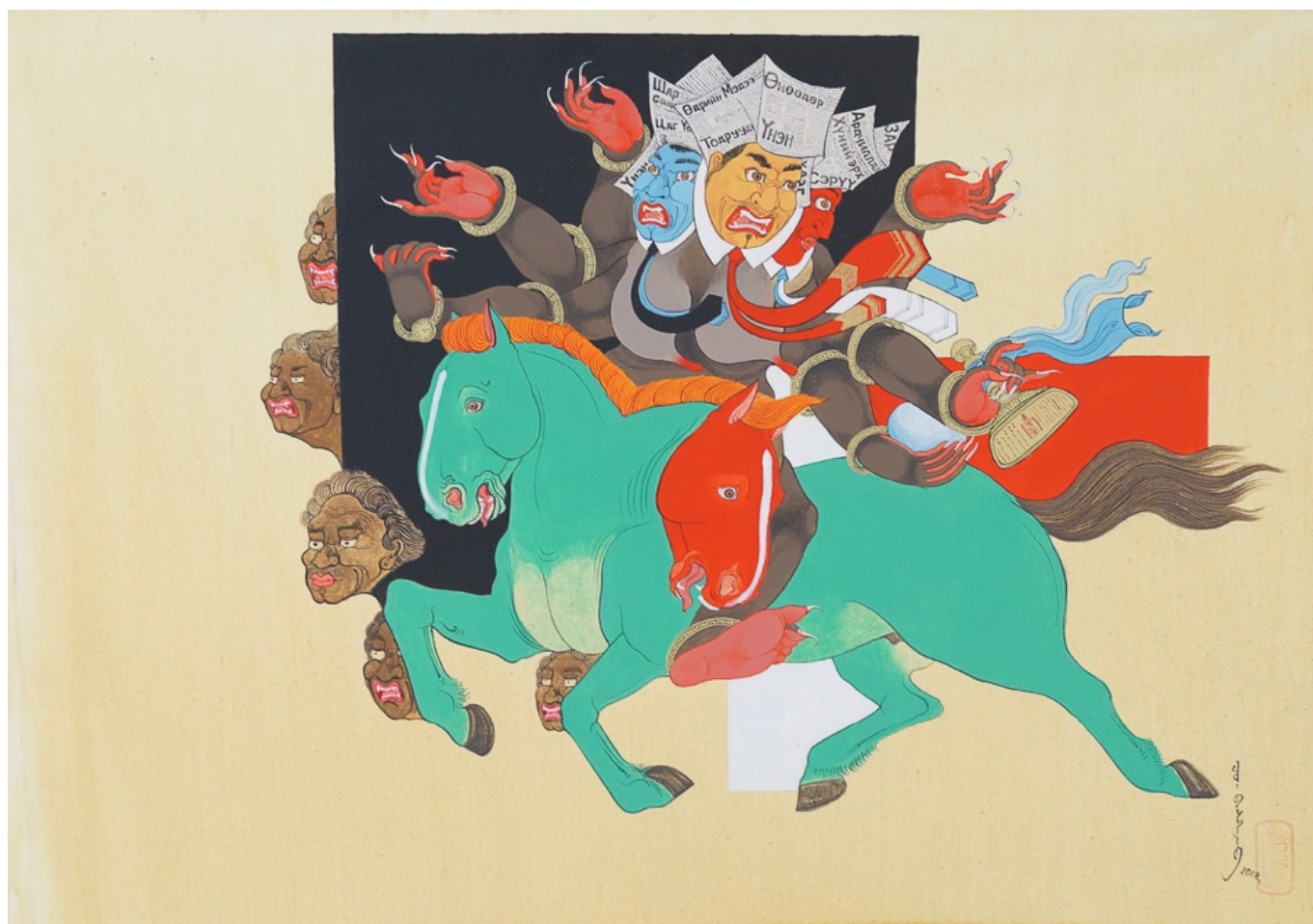
<Baasanjav Choiijiljav (Mongolia), Promise [Promesa], 2018.>