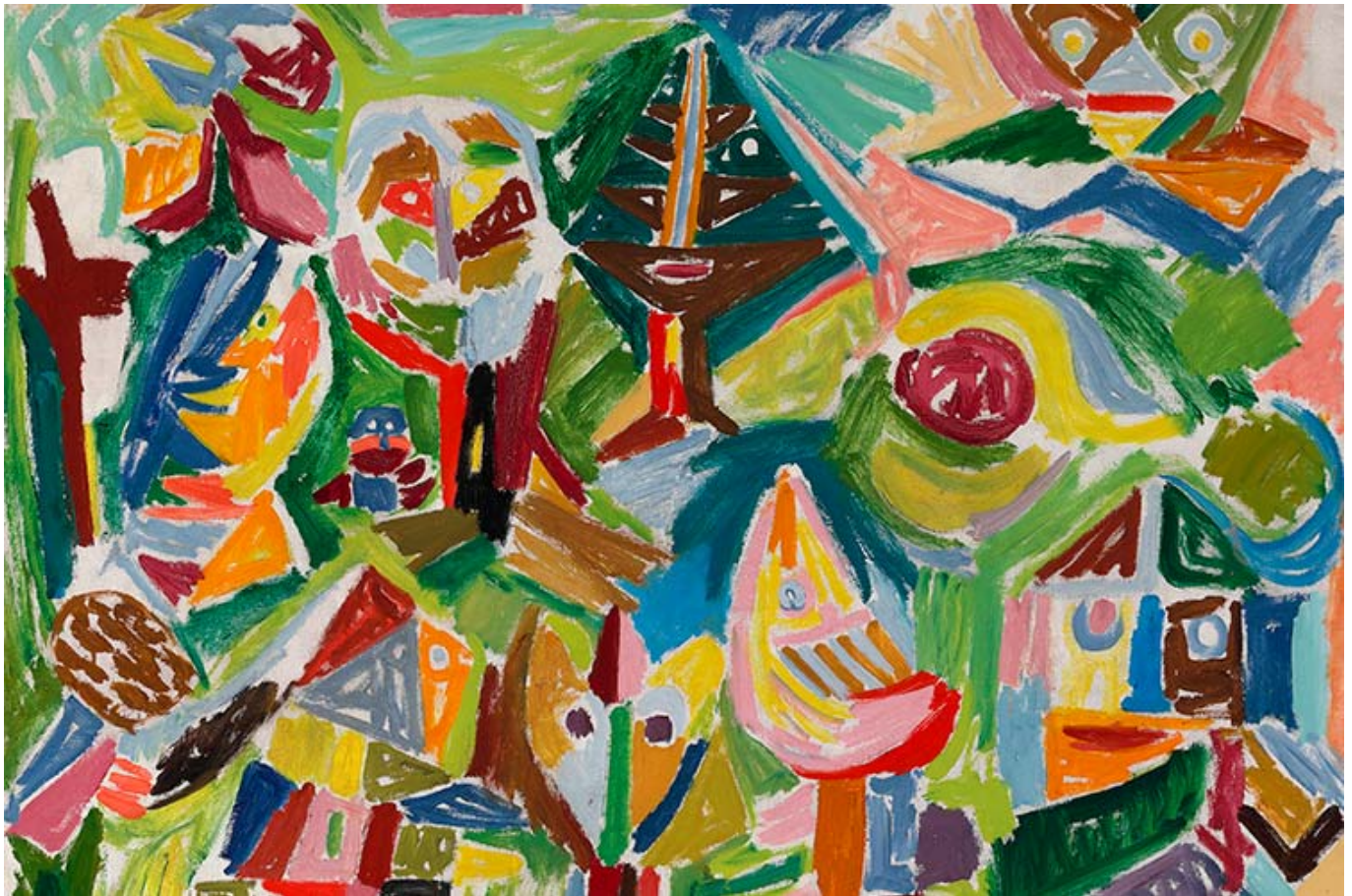
Asger Jorn (Dinamarca), Landscape in Finkidong [Paisaje en Finkidong], 1945.

La idea de lo «local» requiere una evaluación aguda de las jerarquías de clase, etnia y género; no hay «comunidad local» o «economía local» que no esté desgarrada por la explotación y la violencia de estas jerarquías. Del mismo modo, el conocimiento local debe considerarse junto con los avances de la ciencia moderna, cuyos progresos en el campo de la agricultura no deben menospreciarse. Lo que une a la plataforma de la soberanía alimentaria es la nítida línea que crea para distinguirse de la forma capitalista de producción de alimentos.