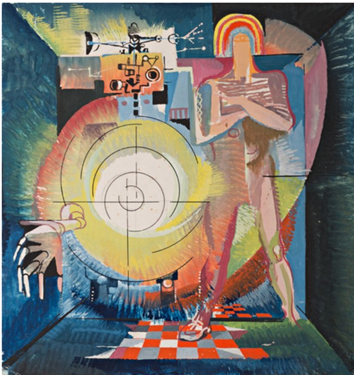
Teodor Rotrekl (Checoslovaquia), Sin título, años 60

Pero el hambre no es inevitable: es, como nos recordó S'bu Zikode, una decisión del capitalismo de anteponer las ganancias por sobre las personas, permitiendo que enormes franjas de la población mundial sigan pasando hambre mientras se desperdicia un tercio de todos los alimentos producidos, todo mientras la liberalización del comercio y la especulación en la producción y distribución de alimentos crean graves distorsiones.