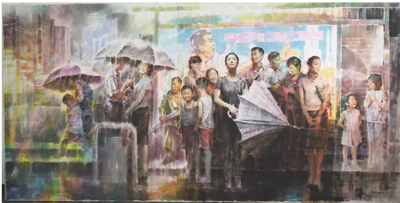
Kim in Sok (República Popular Democrática de Corea), Rain Shower at the Bus Stop [Lluvia en el paradero de autobuses], 2018.

una resolución sobre el «derecho humano al agua y al saneamiento». Como resultado, varios países —como México, Marruecos, Níger y Eslovenia, por nombrar algunos— añadieron este derecho al agua en sus constituciones. Aunque se trata de normativas algo limitadas —con escasa incorporación de la gestión de las aguas residuales y de los medios culturalmente apropiados para el suministro de agua—, han tenido, no obstante, un efecto positivo inmediato, con miles de hogares conectados ahora a servicios de agua potable y alcantarillado.