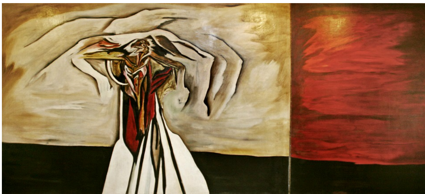
Jaime de Guzman (Filipinas), Metamorfosis II , 1970.