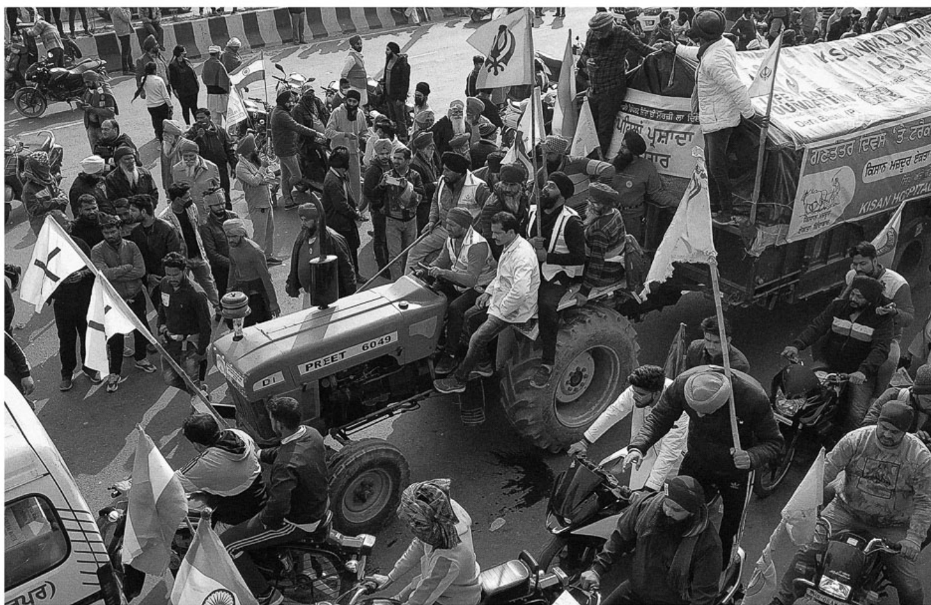
Un contingente de tractores en la carretera GT Karnal rompe las barricadas policiales y entra en Delhi, comenzando un enfrentamiento entre los manifestantes y la policía, 26 de enero de 2021.

En el Instituto Tricontinental de Investigación Social hemos elaborado cuatro importantes dossiers que reflexionan sobre la crisis agraria en la India: una explicación de la revuelta campesina ( La revuelta campesina en India , junio de 2021); un análisis del rol central de las mujeres tanto en el trabajo como en las luchas agrarias ( Las mujeres indias en un arduo camino a la libertad , octubre de 2021); un retrato del impacto del neoliberalismo en las comunidades rurales ( El ataque neoliberal a la India rural: dos relatos de P. Sainath , octubre de 2019); y un estudio sobre los intentos de uberizar la agricultura y el trabajo campesino ( Los gigantes tecnológicos y los retos actuales para la lucha de clases , noviembre de 2021). P. Sainath, miembro principal de nuestro Instituto, ha sido una voz clave en la amplificación de la crisis agraria y las luchas campesinas. La sección que sigue es un extracto de su más reciente editorial en el People's Archive of Rural India :