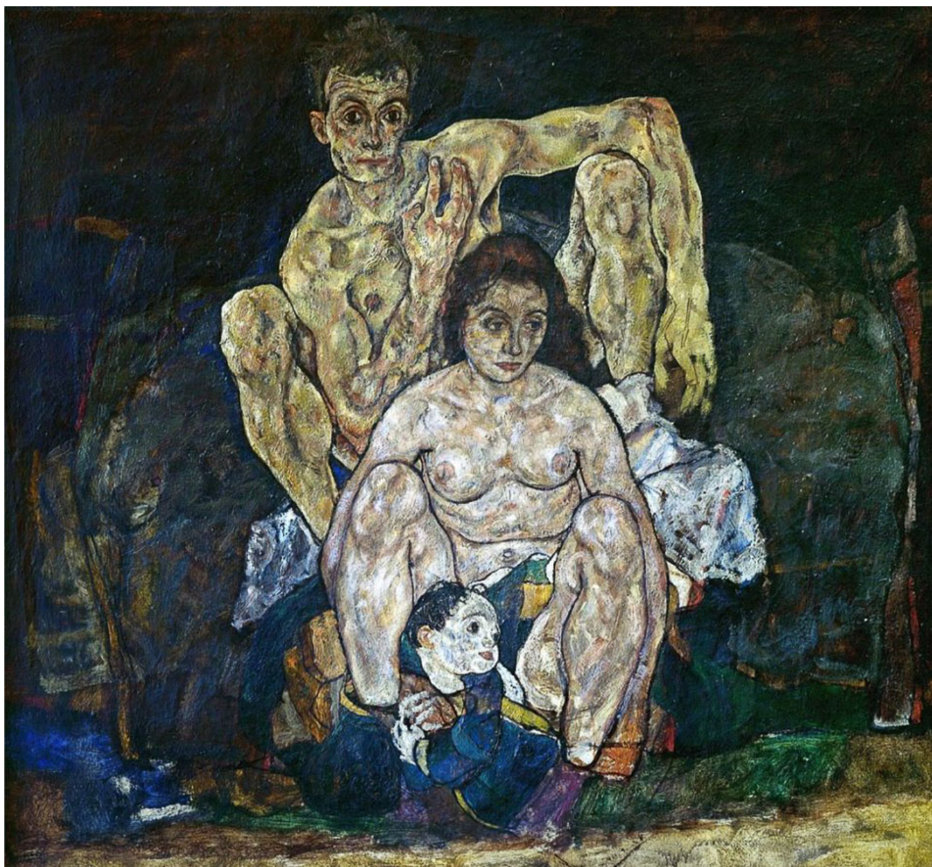
Egon Schiele (Austria), The Family [La familia], 1918.

Es una buena noticia que ya hay candidatas a vacunas de una serie de empresas y países, incluyendo dos vacunas ARNm de Pfizer y Moderna, como también la Sputnik V de Gamaleya y CoronaVac de Sinovac. Los informes de estas y otras candidatas a vacuna muestran resultados positivos, lo que aumenta las esperanzas de que pronto tendremos algún tipo de vacuna contra la covid-19. La comunidad científica desconfía de las afirmaciones hechas por las compañías farmacéuticas privadas, que han publicado comunicados de prensa pero no han hecho públicos los resultados de sus ensayos clínicos. Algunas de estas preguntas incluyen si las vacunas previenen el contagio, si previenen la mortalidad, si previenen la transmisión, y, finalmente, cuánto duraría la protección.