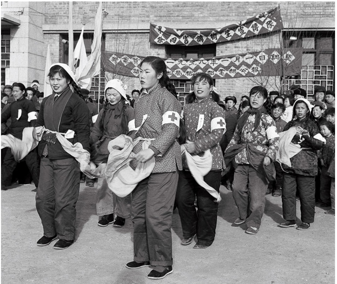
Equipo de salud pública para la eliminación de las "cuatro plagas", China, 1958.