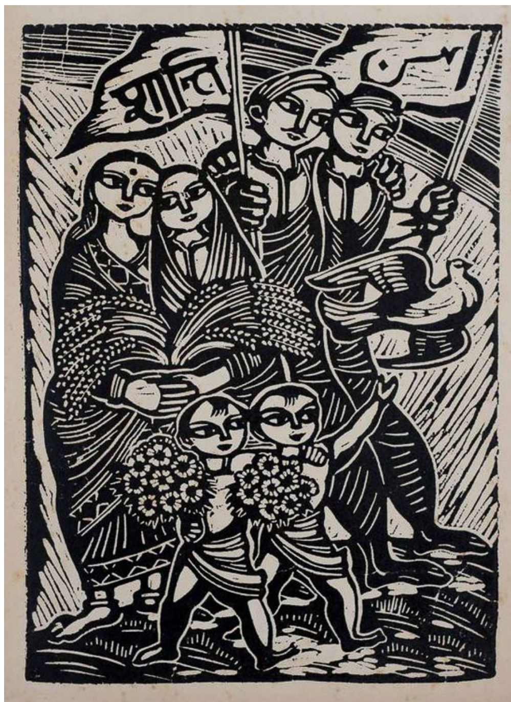
Chittaprosad (India), Peace [Paz], sin fecha.