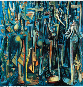
Wladimir Lenin, La pugna, 1923