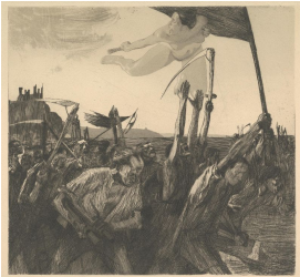
Karl Kautsky, España, 1899

El informe de la ONU describe el deterioro de los ecosistemas, la crisis del capitalismo. Más que "nuestro crecimiento alterado", como maximizan las ganancias — el fin de la actividad económica debiera ser "la mejora de la vida y la reducción de las emisiones". La actividad económica cobraba sentido no abandonando el crecimiento económico, "escriben los académicos finlandeses, "sino reconstruyendo la infraestructura y las prácticas en función de un mundo que combata los límites con una carga radicalmente menor sobre nuestros ecosistemas naturales". El nuevo resumen del informe de la ONU, en este sentido, señala que la transición "implicaría un cambio más allá de los indicadores económicos estándar, como el producto interno bruto, para incluir aquellos capaces de capturar una visión más holística y de largo plazo de la economía y la calidad de vida". Incapaz de darle un nombre a todo esto, el informe sugiere que el único antídoto para la extinción liderado por la humanidad es el socialismo.