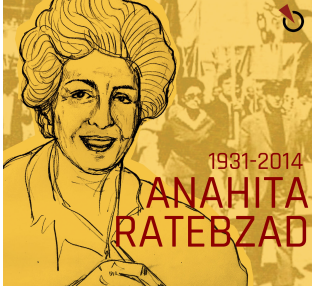
1931-2014 ANAHITA RATEBZAD