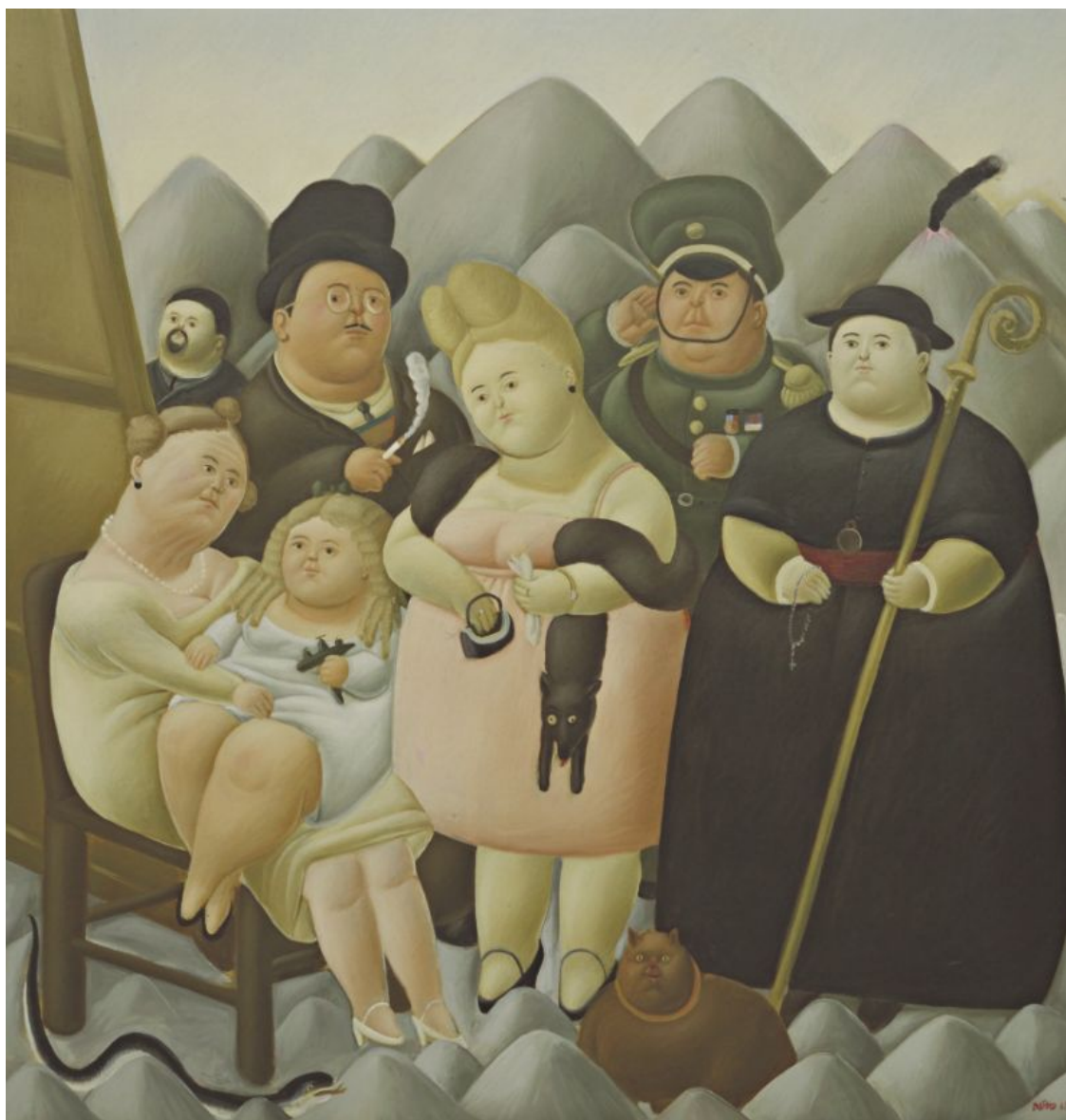
Fernando Botero, La familia presidencial , 1967

¿Mejores políticas? Durante las últimas décadas, la presión de instituciones tales como el Fondo Monetario Internacional y el Banco Mundial, así como de bancos comerciales, ha reducido el alcance de la intervención del Estado contra la pobreza. La teoría general es esperar que la pobreza pueda ser erradicada a través de la filantropía y la caridad. Todos los ojos apuntan a los multimillonarios, esperando que donen su riqueza para eliminar las desigualdades en el mundo. Pero esas donaciones son exiguas, su impacto es intrascendente.