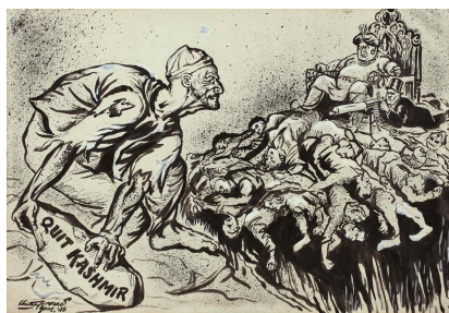
Chittaprosad, Quit Kashmir, 1946.

Boletín 33 (2019): La historia suele avanzar a saltos y zigzagueos