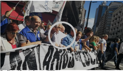
Paro Nacional Bancario, Argentina (2018)

En diciembre de 2019 nuestro Dossier N° 23 hará una evaluación general de la situación en Sudamérica tras las elecciones de octubre en Argentina, Bolivia y Uruguay. Dilma Rousseff, la expresidenta de Brasil, reflexionó sobre los resultados de las primarias en Argentina señalando que esto era una "luz al final del túnel para Argentina y Latinoamérica"