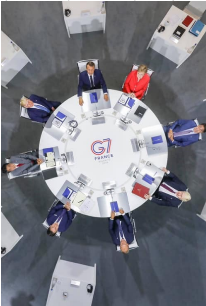
Jefes de Estado de las potencias del G7 en Biarritz, Francia

El año pasado, las Fuerzas Armadas Suecas lanzaron una bomba GBU-49 guiada por láser sobre un incendio forestal. La onda expansiva acabó parcialmente con el oxígeno que alimentaba al fuego. Es aterrador pensar que el antídoto a los incendios forestales serán los bombardeos, y la cura para los huracanes será la guerra nuclear. Esta es una guerra contra el planeta, locura tras locura, con el lado más cruel de la inhumanidad en los controles.