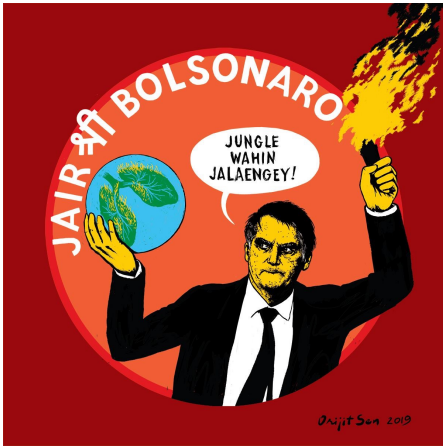
Bolsonaro por Orijit Sen, 2019. Bolsonaro dice: Quemaremos la selva ahí mismo (un eco de un eslogan de derecha de India, "Construiremos el templo ahí mismo, encima de una mezquita").

A Bolsonaro, quien actualmente está enojado con Macron por sus críticas sobre los incendios en el Amazonas, le hubiera encantado estar ahí. Los agricultores en Francia, Finlandia y Alemania están ansiosos por cortar la exportación de carne brasilera a Europa, como parte de una campaña para cancelar el tratado recientemente firmado entre la Unión Europea y el Mercosur (el bloque comercial de Argentina, Brasil, Paraguay, Uruguay y Venezuela). Brasil está ansioso por ser parte de la OCDE (Organización para la Cooperación y el Desarrollo Económico), el grupo de elite de 36 estados que dicen ser los países más desarrollados, y que por lo tanto son capaces de atraer inversiones. Es probable que la OCDE ya no tome seriamente la postulación de Brasil, ya que ahora hay dudas respecto al compromiso de Brasil con los estándares medioambientales de la OCDE. Bolsonaro está obligado a retroceder para mantener vivos los tratados comerciales y la esperanza de la OCDE.