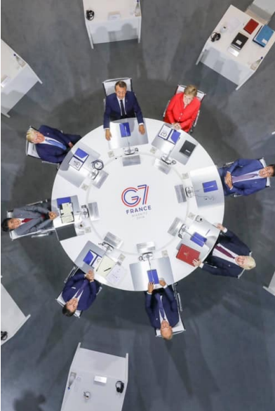
Jefes de Estado de las potencias del G7 en Biarritz, Francia

El año pasado, las Fuerzas Aéreas Suecas lanzaron una bomba GBU-49 guiada por láser sobre un incendio forestal. La onda expansiva acabó parcialmente con el oxígeno que alimentaba al fuego. Es aterrador pensar que el antídoto a los incendios forestales serán los bombardeos, y la cura para los huracanes será la guerra nuclear. Esta es una guerra contra el planeta, locura tras locura, con el lado más cruel de la inhumanidad en los controles.