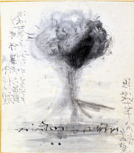
Ikuo Hirayama, Thinking Aug. 6 in the 20th year of Showa [Pensando en el 6 de agosto en el 20º año de Showa]