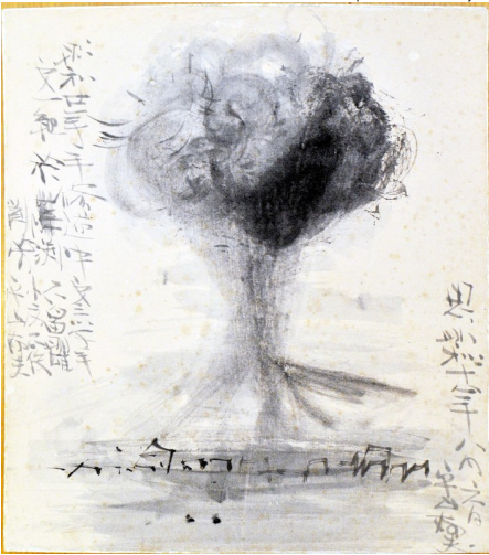
Ikuo Hirayama, Thinking Aug. 6 in the 20th year of Showa [Pensando en el 6 de agosto en el 20º año de Showa]

Si no fuera por las protestas globales contra estos incendios, y si Evo Morales en Bolivia no hubiera contratado rápidamente un Boeing 747 para lanzar agua a los incendios, parece poco probable que Bolsonaro hubiera hecho algo. La política del Laissez-faire es solo invocada cuando se trata de la destrucción de la vida de personas comunes y corrientes (austeridad) y del planeta (catástrofe climática); la bandera del laissez-faire se esconde cuando se trata de rescatar y apoyar a los bancos privados internacionales.