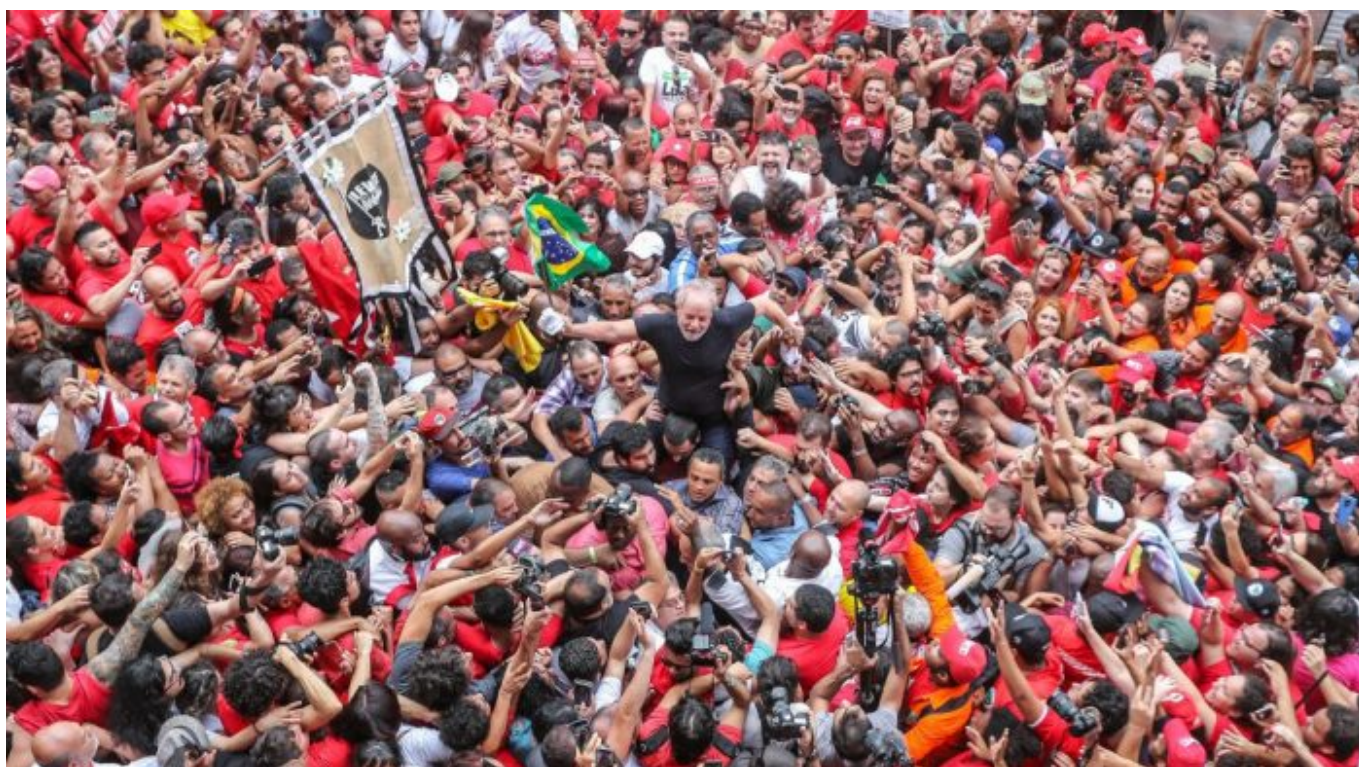
Lula en las calles de São Paulo, noviembre de 2019.

Puede que Bolivia haya sido borrada de los mapas, pero siguió siendo una gran fuente de plata y estaño para las empresas transnacionales de Europa y Estados Unidos. Actualmente continúa siendo una gran fuente de estaño y alberga más del 70% de las reservas mundiales de litio. Se espera que la demanda de litio —usado para baterías de automóviles eléctricos y aparatos electrónicos como teléfonos móviles— al menos se duplique para 2025. El gobierno de Morales estableció altos estándares para sus socios mineros: exigió que al menos la mitad del control de las minas permaneciera con las empresas mineras bolivianas, y que las ganancias sean utilizadas para el desarrollo social. Las empresas transnacionales demandaron a Bolivia por romper sus contratos, y rechazaron los nuevos estándares del gobierno de Morales. Las únicas empresas que accedieron a los términos bolivianos fueron las de China. Los acuerdos de Morales con estas compañías chinas irritaron no solamente a las empresas transnacionales, sino también a sus gobiernos (de Estados Unidos, Canadá y la Unión Europea). Un objetivo del golpe de Estado es que estas empresas vuelvan a controlar los recursos naturales bolivianos, especialmente el litio, que es esencial para hacer automóviles eléctricos.