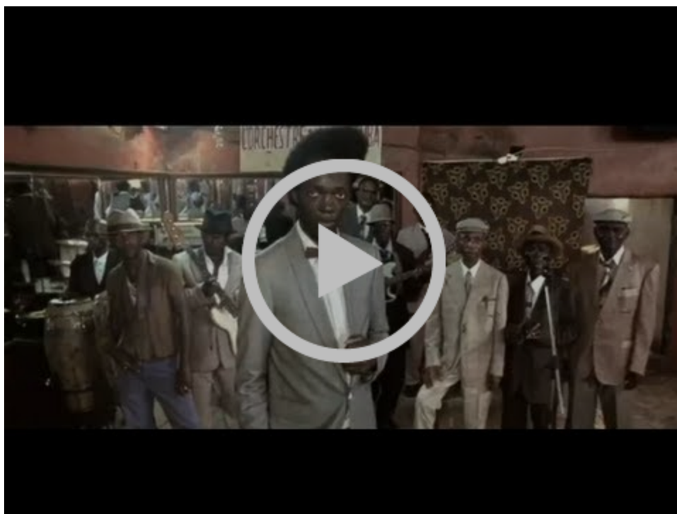
Baloji, El día después/Siku Ya Baadaye (Independencia Cha-Cha) , 2011.