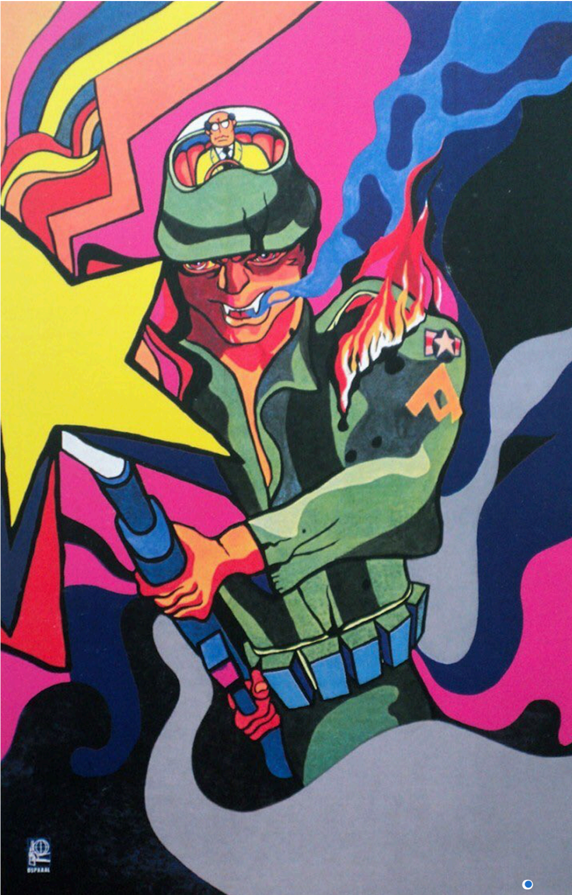
Alfredo Rostgaard, OSPAAAL poster, 1969.