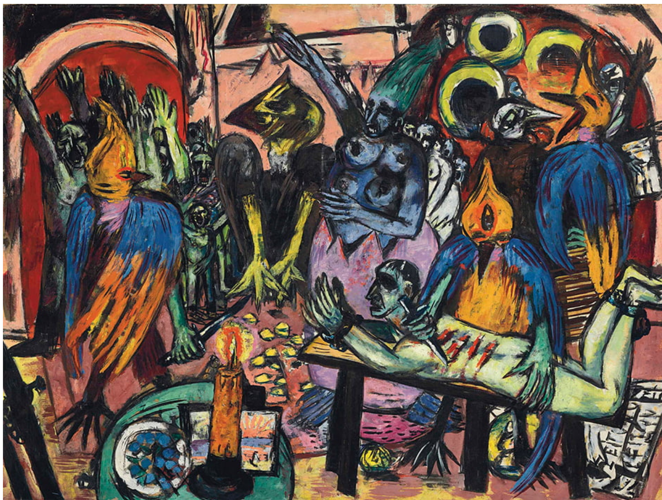
Max Beckmann, Hölle der Vögel, 1937-38.

A la burguesía le interesa destruir cualquier proyecto de la clase trabajadora y el campesinado. Esto puede hacerse a través del uso de la violencia, la ley, o del espejismo del éxito, es decir, la creación de aspiraciones dentro del capitalismo que destruyen la plataforma política para una sociedad postcapitalista. Se burlan de los partidos populares por su fracaso en producir una utopía dentro de los límites del capitalismo, se burlan porque se dice que sus proyectos no son realistas. El espejismo del éxito y los sueños góticos son vistos como razonables, mientras el socialismo se representa como irrealizable.