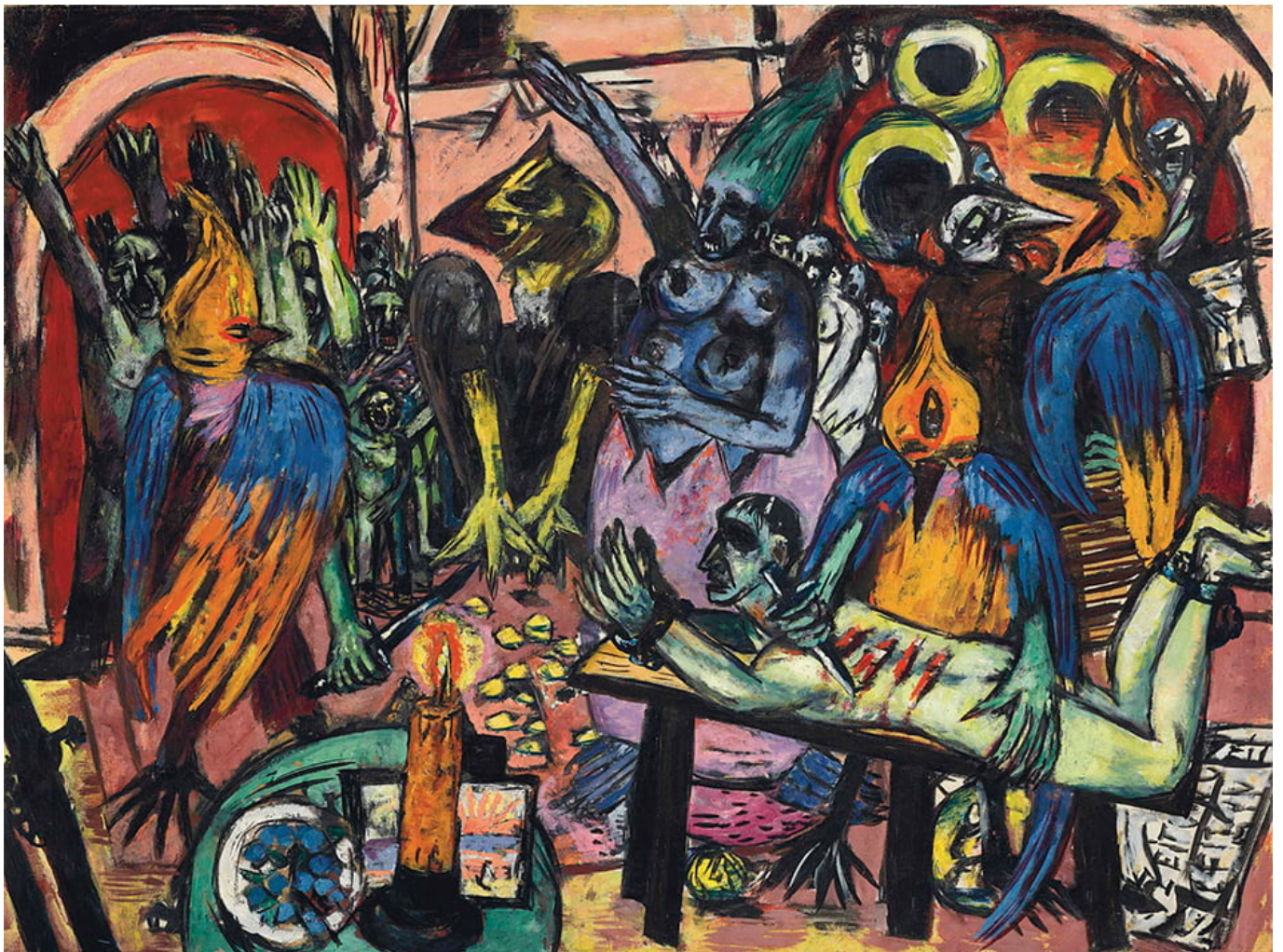
Max Beckmann, Hölle der Vögel, 1937-38.

A la burguesía le interesa destruir cualquier proyecto de la clase trabajadora y el campesinado. Esto puede hacerse a través del uso de la violencia, la ley, o del espejismo del éxito, es decir, la creación de aspiraciones dentro del capitalismo que destruyen la plataforma política para una sociedad postcapitalista. Se burlan de los partidos populares por su fracaso en producir una utopía dentro de los límites del capitalismo, se burlan porque se dice que sus proyectos no son realistas. El espejismo del éxito y los sueños góticos son vistos como razonables, mientras el socialismo se representa como irrealizable.