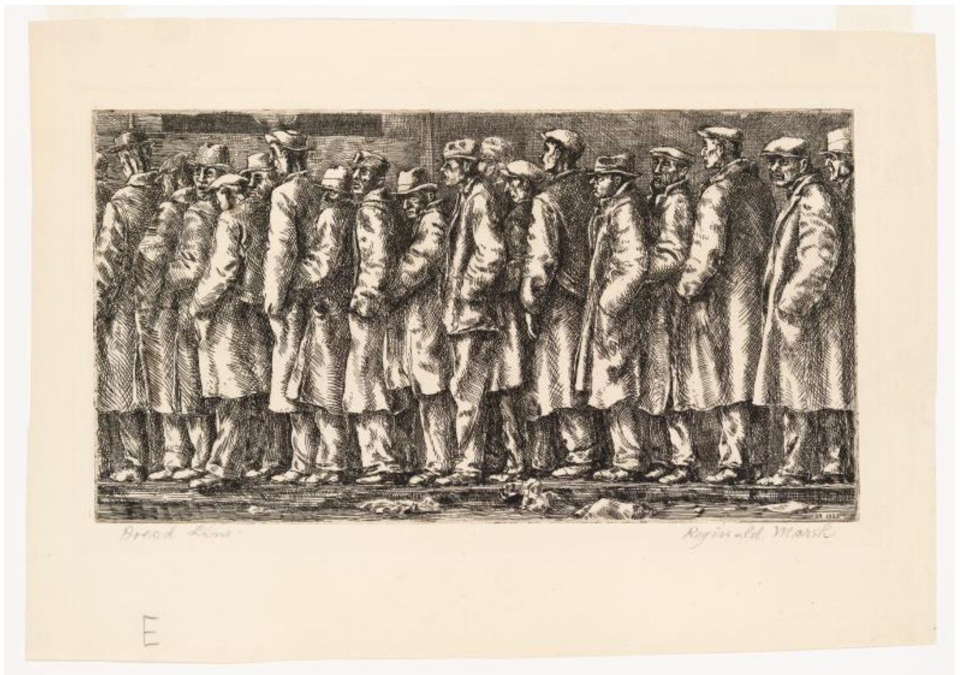
Reginald Marsh, Bread Line - No One Has Starved (Línea para el pan - Nadie ha muerto de hambre), 1932.

El espejismo se amplifica cuando se cortan en pedazos las estructuras básicas del bienestar social que han sido empujadas por el pueblo a la agenda de los gobiernos. Para aliviar la crudeza de la desigualdad social producida por la apropiación privada de la riqueza social por parte de la burguesía, el Estado se ve forzado por el pueblo a crear medidas de bienestar social: salud y educación públicas, así como programas focalizados para las personas en situación de pobreza e indigencia. Si estas medidas no se implementan las personas comenzarán a morir, por montones, en las calles, lo que pondría en tela de juicio el espejismo del éxito. Sin embargo, como consecuencia de la larga crisis de rentabilidad, estos programas han sido recortados durante las últimas décadas. El resultado de esta crisis de la democracia liberal debida a las políticas neoliberales de austeridad es una alta inseguridad económica y un creciente enojo frente al sistema. Una crisis de rentabilidad se transforma en una crisis de legitimidad política.