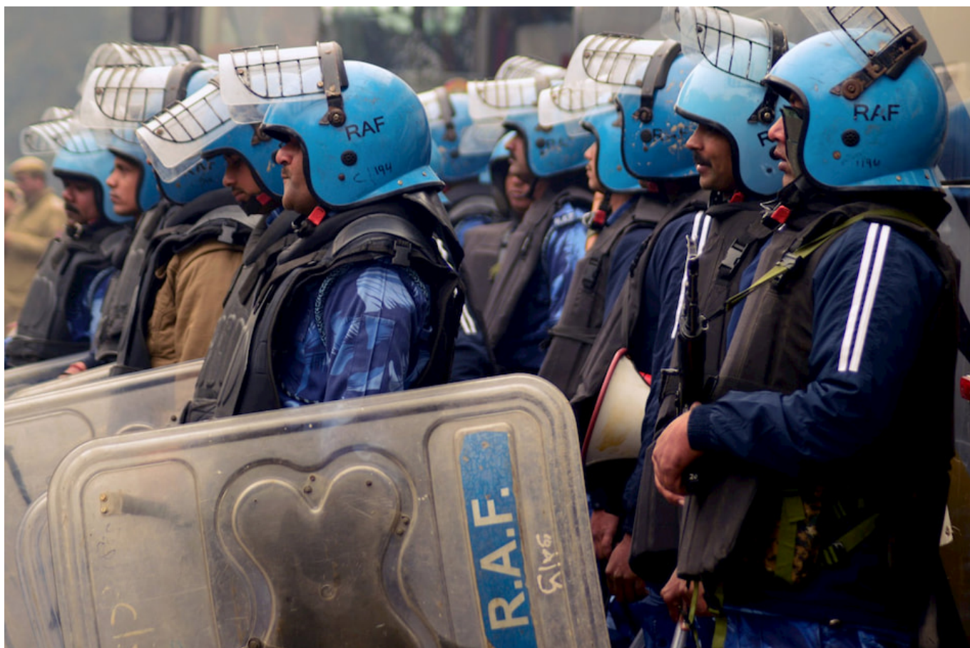
V. Arun Kumar (People's Dispatch), Fuerzas de Acción Rápida, Delhi, 19 de diciembre de 2019.

Las minorías son privadas de representación en nombre de la democracia; se da rienda suelta a la violencia en nombre de los sentimientos de la mayoría. La ciudadanía se estrecha según las definiciones de la mayoría; se le dice a la gente que acepte la cultura de la mayoría. Esto es lo que el gobierno del BJP ha hecho en India con la Ley de Ciudadanía (Enmienda) de 2019. Eso es lo que la gente rechaza.