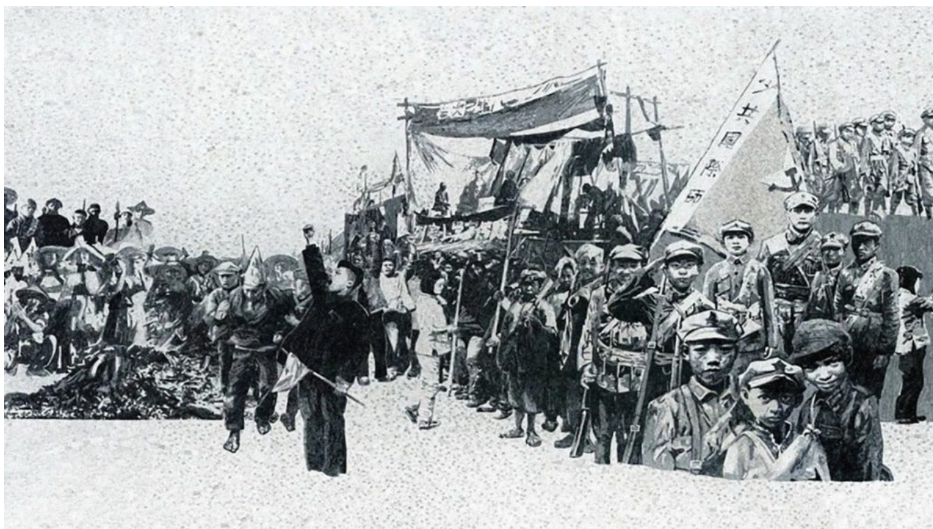
Ye Wulin (China), 红星颂 [Oda a la estrella roja], detalle, 2015.

Las palabras de Mao hacían eco de los sentimientos de los movimientos anticoloniales de todo el mundo, incluidos los líderes de movimientos que no eran socialistas, como Jawaharlal Nehru de India y Gamal Abdel Nasser de Egipto. Para ellos, el proceso de descolonización requería paz e igualdad mundiales, de modo que los pueblos del mundo antes colonizados pudieran levantarse y construir sus vidas con dignidad. Leer y reflexionar sobre estas palabras en 2024 nos permite apreciar, tanto los avances logrados por los pueblos del mundo desde 1949, como la obstinación de las antiguas potencias coloniales que llevan mucho tiempo intentando impedir que se construya este nuevo mundo. El actual genocidio del pueblo palestino a manos de Estados Unidos e Israel y el bombardeo de Líbano reflejan la barbarie a la que están dispuestas a recurrir las potencias coloniales en su intento de mantenernos en ese pasado que queremos trascender. Las actitudes y guerras impuestas por las viejas potencias coloniales nos desvían de la construcción de “nuestra propia civilización y bienestar” y de “promover la paz y la libertad en el mundo”. Las palabras de Mao, que en realidad son las palabras de todos los pueblos que salen del colonialismo, ofrecen al mundo una elección: o vivimos como adversarios con nuestros recursos vertidos en guerras feas y sin sentido, o construimos la “comunidad de naciones del mundo amantes de la paz y de la libertad”.