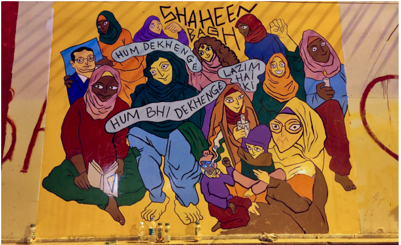
Everything Will Be Remembered (Todo será recordado), de Aamir Aziz, proviene de las protestas interminables en India contra la ley de ciudadanía y contra un gobierno insensible a lo que piden las calles.

Mátennos, nos transformaremos en fantasmas y escribiremos sobre sus asesinatos, con todas las pruebas. Ustedes escriben chistes en los tribunales; nosotros escribiremos “justicia” en los muros. Hablabremos tan fuerte que hasta lxs sordxs oirán. Escribiremos tan claro que hasta lxs ciegrxs leerán. Ustedes escriben “loto negro”; nosotros escribimos “rosa roja”. Ustedes escriben “injusticia” en la tierra; nosotros escribiremos “revolución” en el cielo. Todo será recordado; todo será registrado Así que puede que les envíen maldiciones; para que sus caras sean difamadas; sus nombres y sus caras serán recordados; todo será recordado;