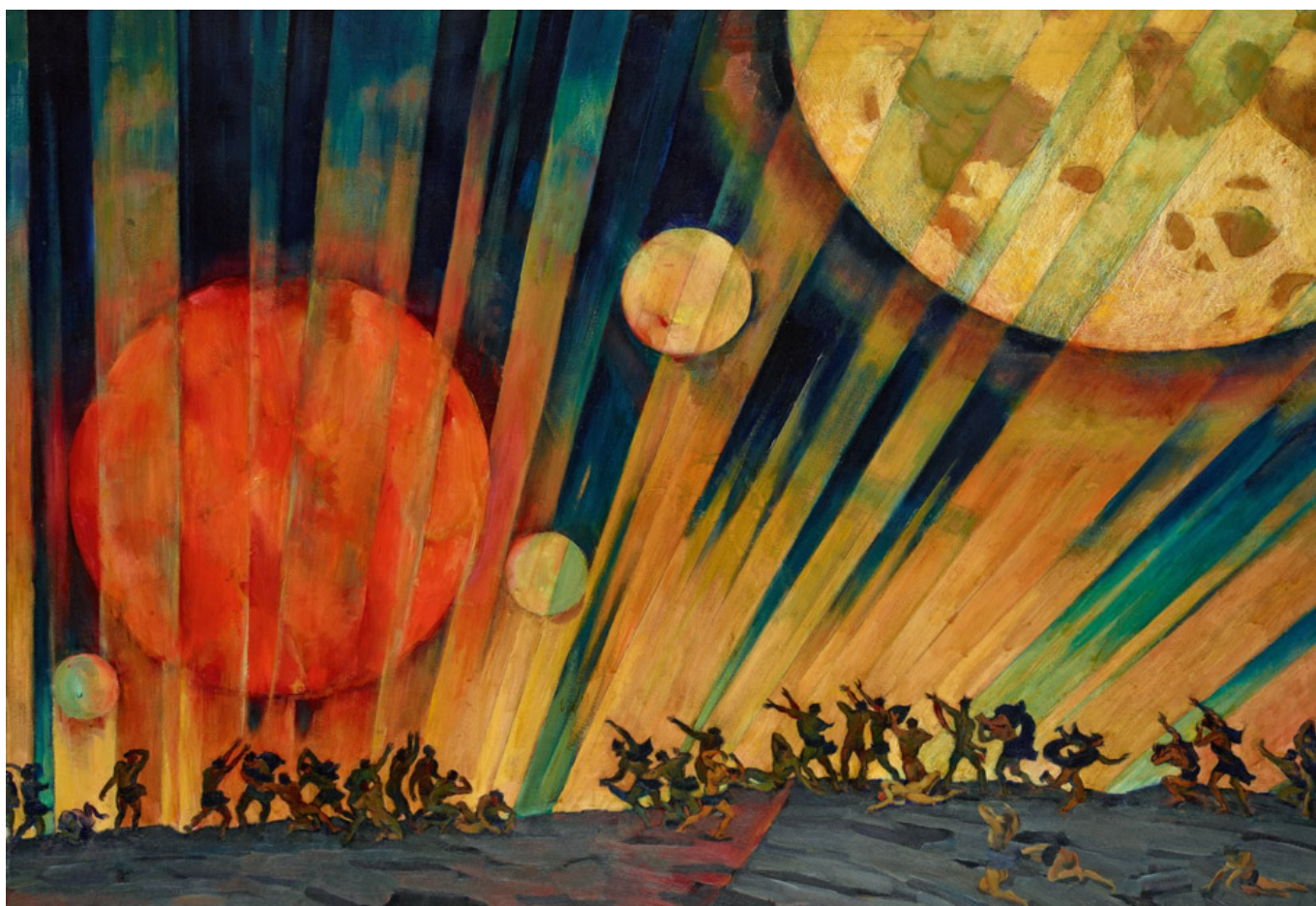
Konstantin Yuon, New Planet (Planeta nuevo), 1921.