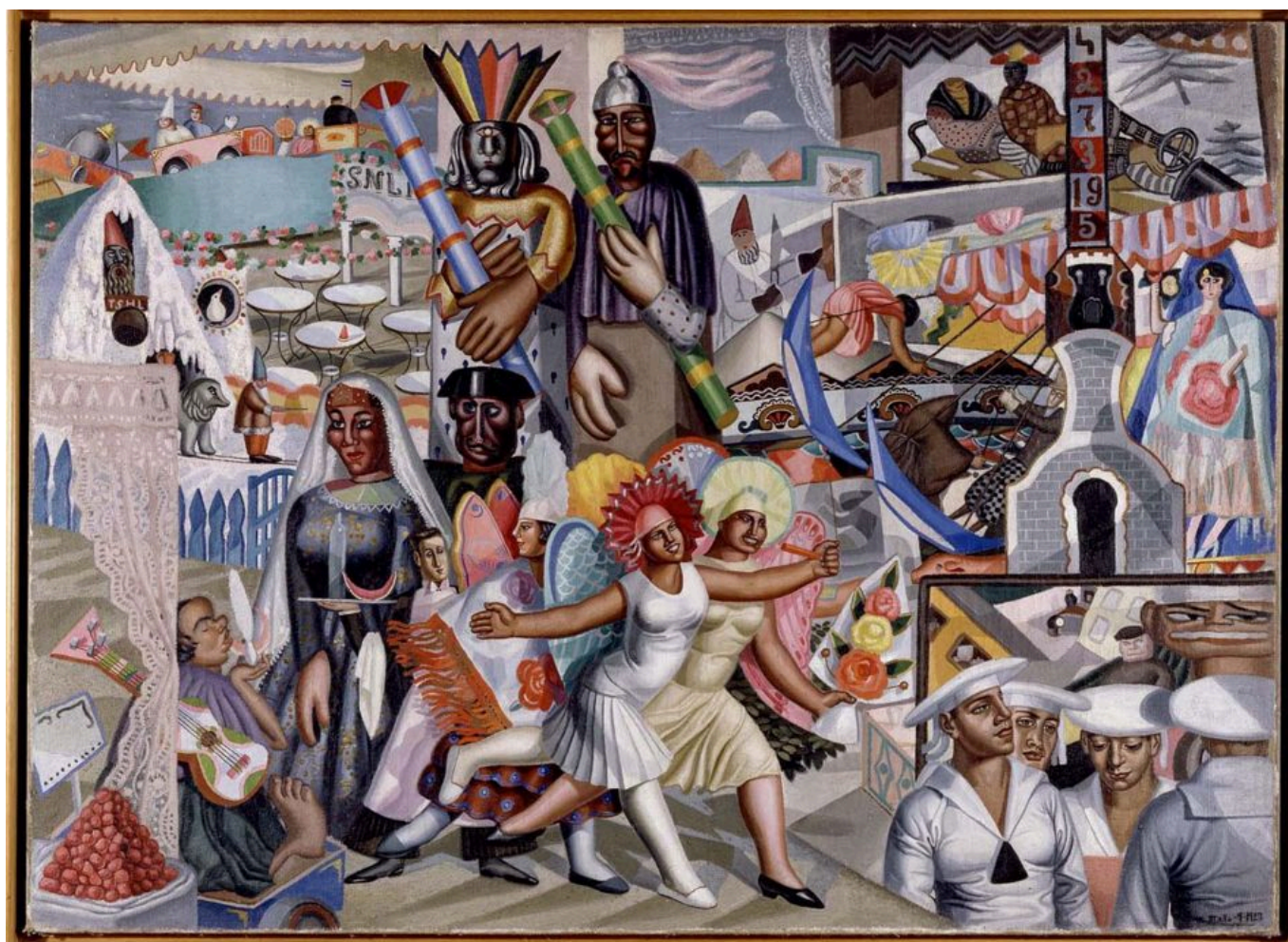
Maruja Mallo (España), La Verbena , 1927.