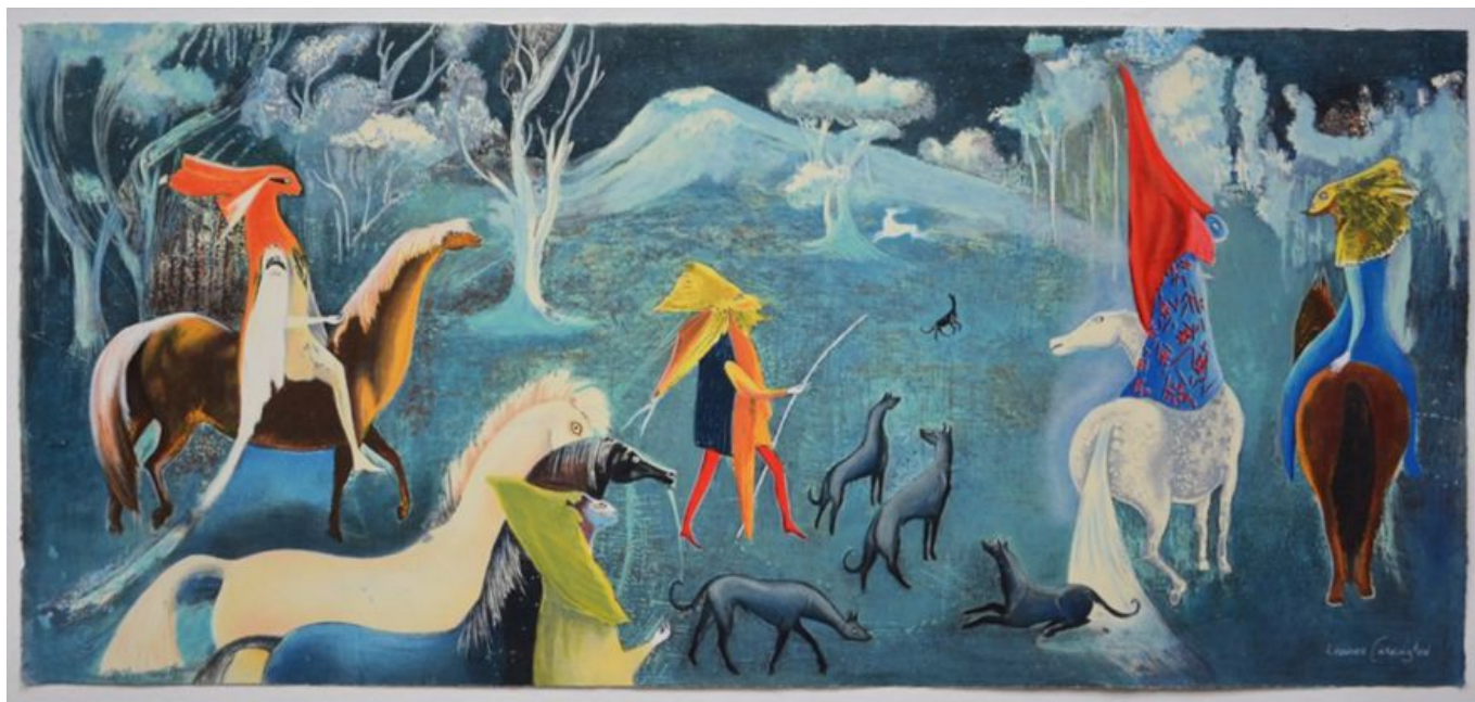
Leonora Carrington (México), Figuras fantásticas a caballo , 2011.

La Gran Recesión que se inició con la crisis financiera mundial de 2007–2008 invalidó cada vez más las credenciales políticas de los “centristas” que habían gestionado el régimen de austeridad. El Informe sobre la