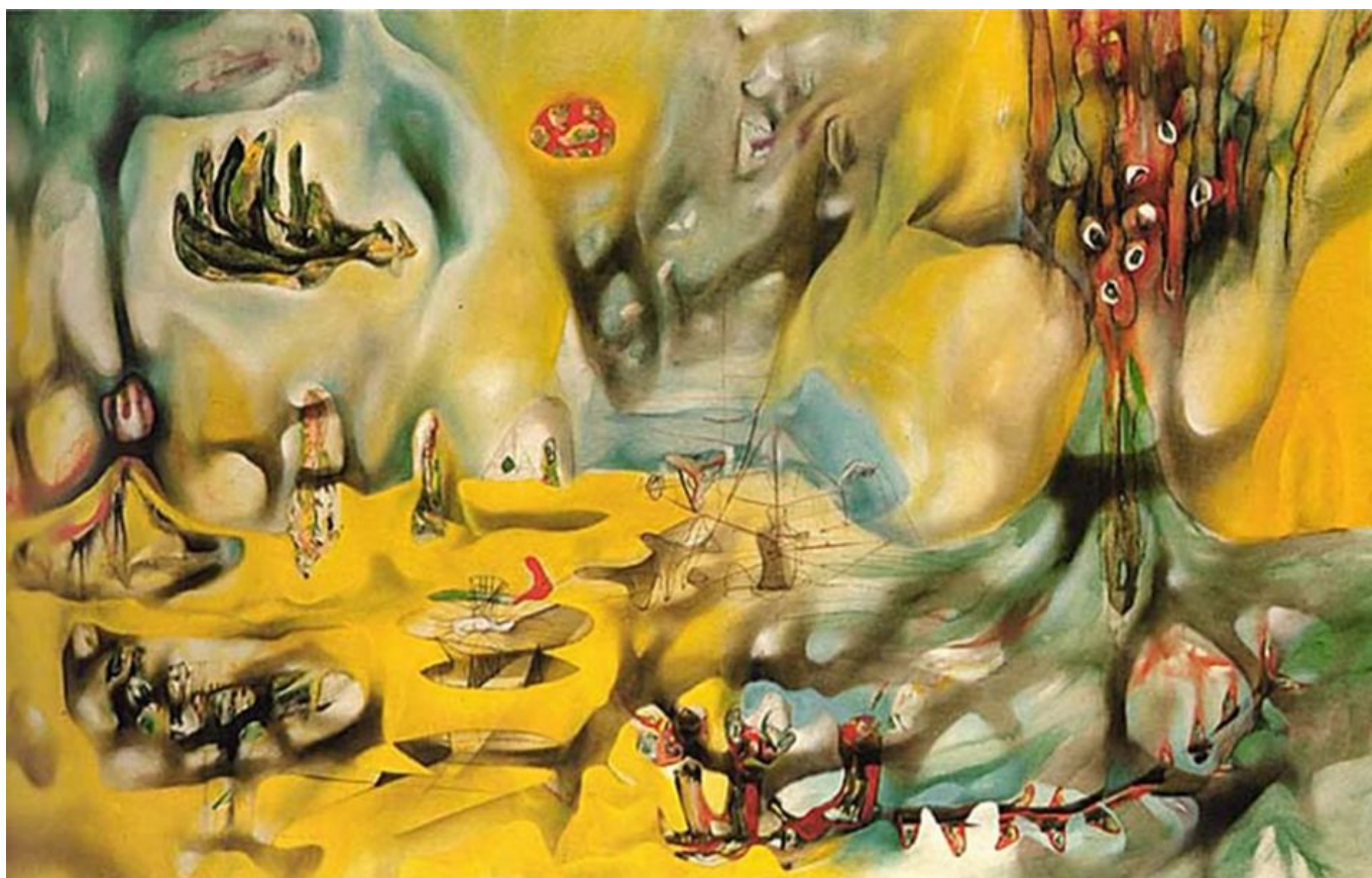
Roberto Matta (Chile), Invasion of the Night [Invasión de la noche], 1942.

El Banco Mundial ha dado la voz de alarma, pero las fuerzas del “centrismo” —en deuda con la clase multimillonaria y la política de austeridad— simplemente se niegan a apartarse de la catástrofe neoliberal. Si un líder de centroizquierda o de izquierda intenta sacar a su país de la persistente desigualdad social y de la polarizada distribución de la riqueza, se enfrenta a la ira no solo de los «centristas», sino también de los ricos tenedores de bonos del Norte, del Fondo Monetario Internacional y de los Estados occidentales.