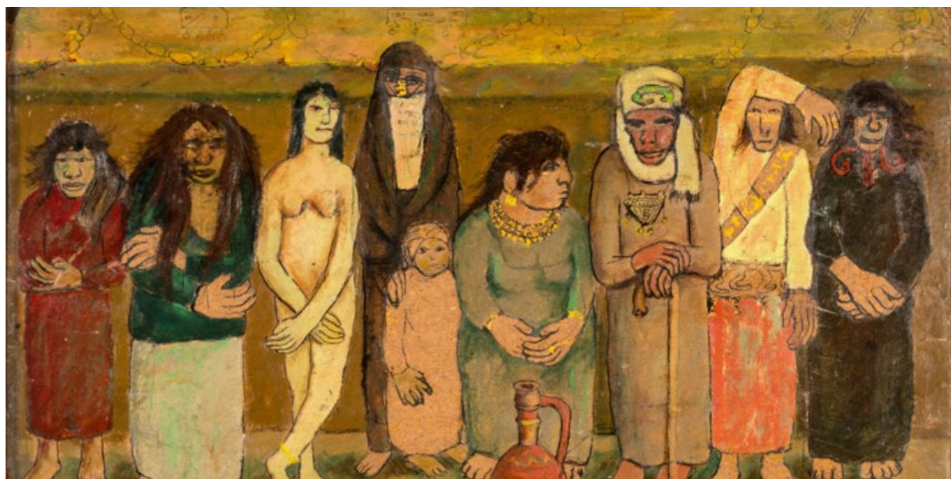
Abdel Hadi el-Gazzar (Egipto), The Popular Chorus or Food or Comrades on the Theatre of Life [El coro popular o La comida o Camaradas en el teatro de la vida], 1948 (fechaado en 1951).