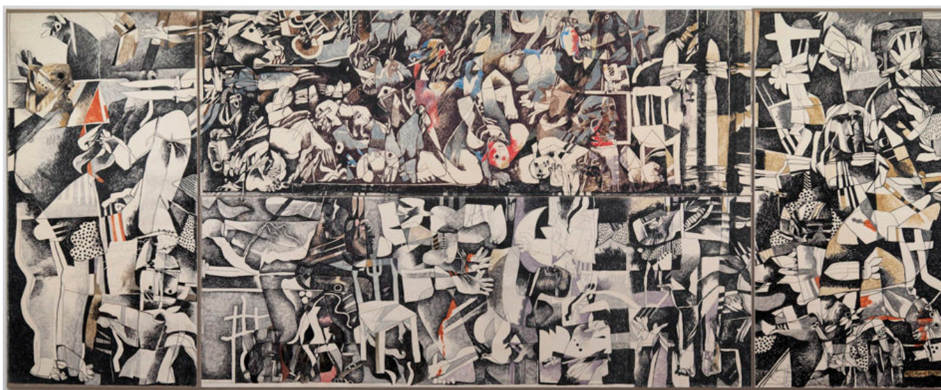
Dia Al-Azzawi (Irak), Sabra and Shatila Massacre ('Masacre de Sabra y Shatila'), 1982-83.