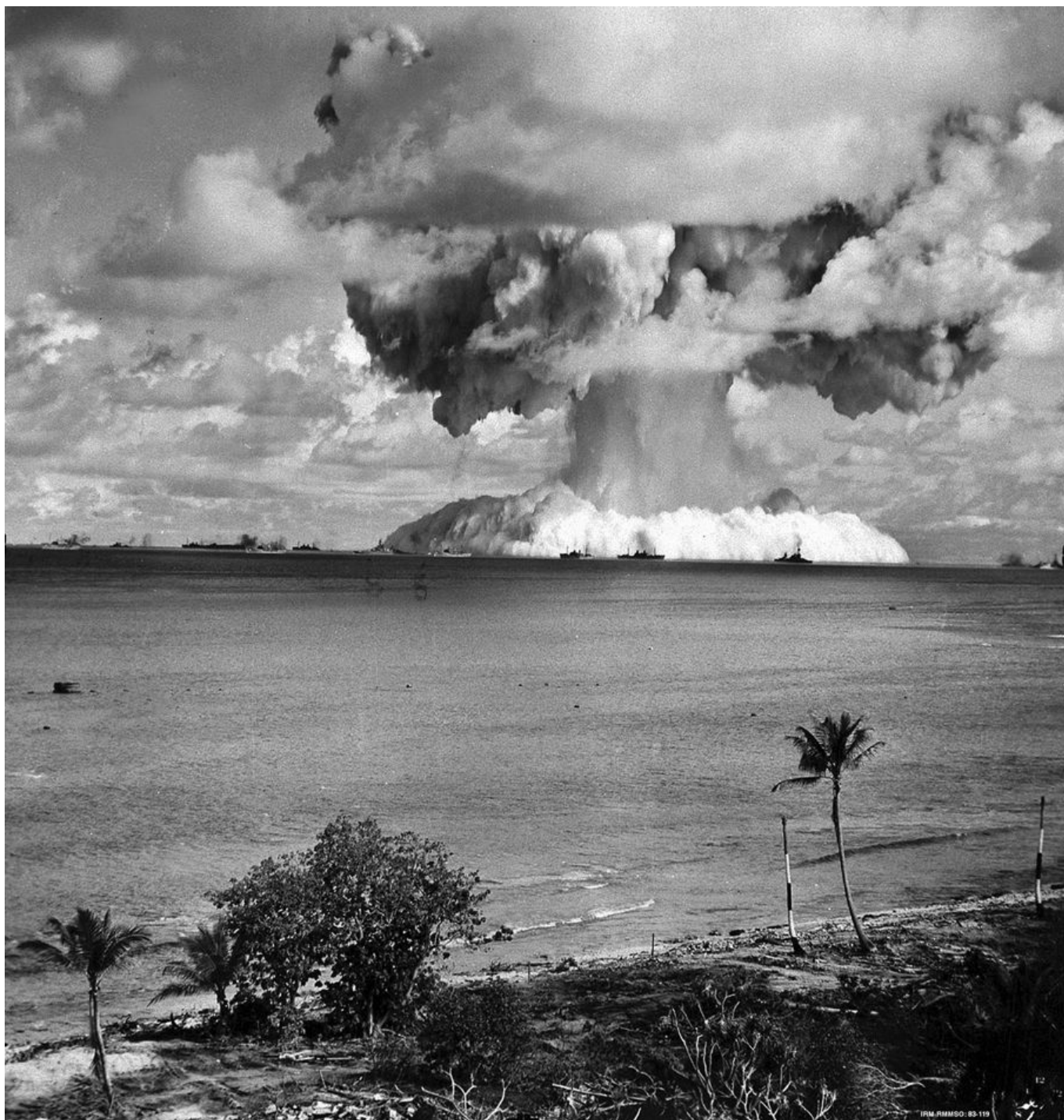
Prueba atómica Shot Baker en el marco de la Operación Crossroads, Atolón de Bikini (Islas Marshall), 1946.

Fijémonos en la forma en que Estados Unidos ha reaccionado a un acuerdo entre las Islas Salomón y China, dos países vecinos. El Primer Ministro de las Islas Salomón, Manasseh Sogavare, dijo que este acuerdo busca promover el comercio y la cooperación humanitaria, no la militarización del Océano Pacífico. El mismo día