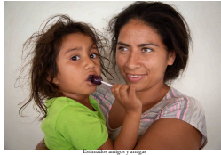
Intervista con el autor