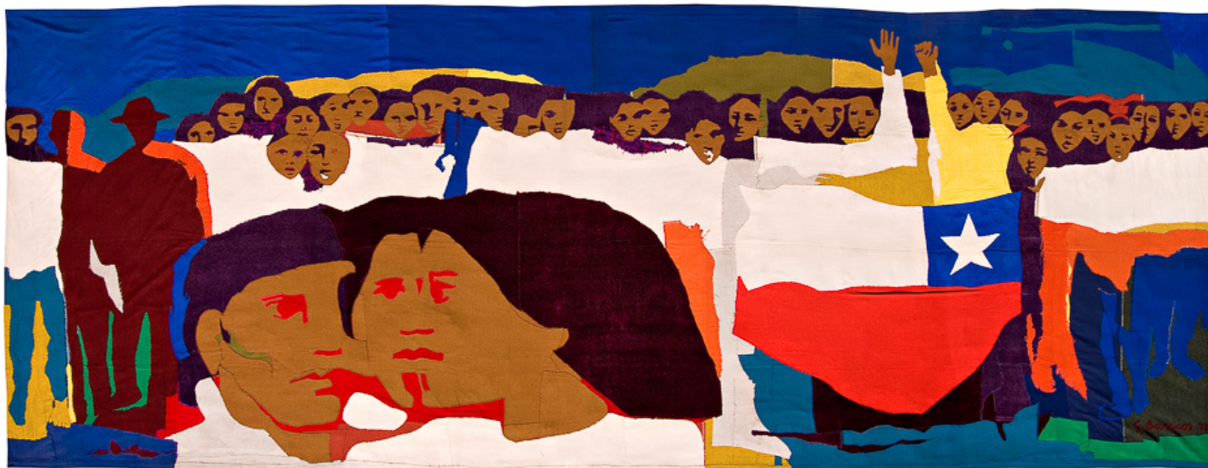
Gracia Barrios (Chile), Multitud III , 1972.