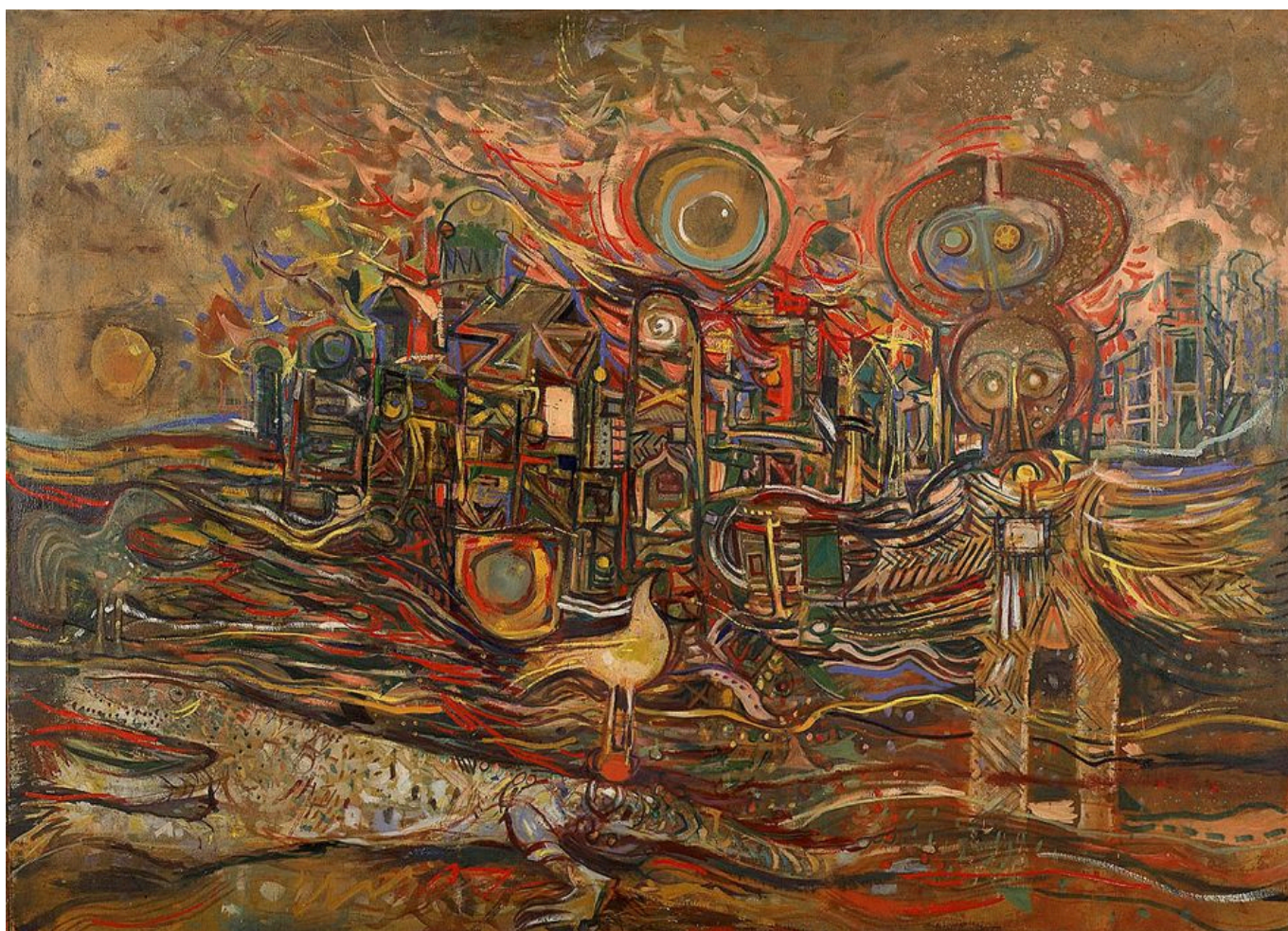
Skunder Boghossian (Etiopía), The End of the Beginning [El fin del comienzo], 1972-73.

Como era de esperar, aunque Estados Unidos ha logrado consolidar el apoyo a su agenda entre varios de sus aliados occidentales, sus esfuerzos han fracasado en el Sur Global. A los países en desarrollo les interesa que estas tecnologías avanzadas se distribuyan lo más ampliamente posible, no que estén controladas por unos pocos Estados.