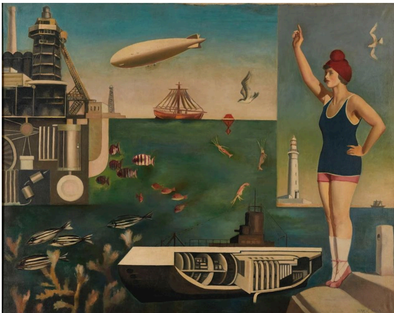
Koga Harue (Japón), Umi ('El mar'), 1929.