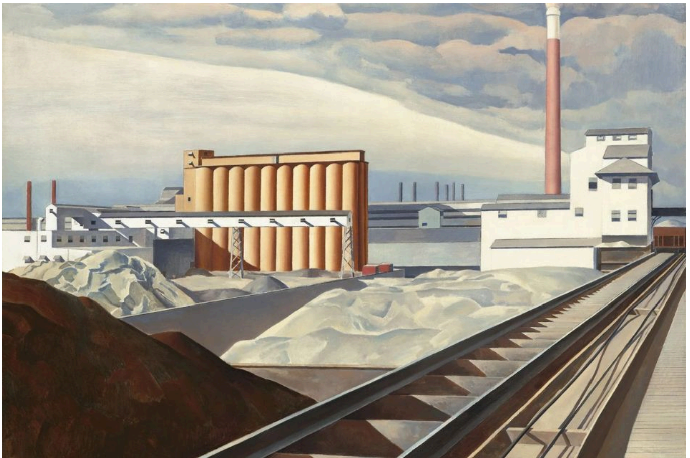
Charles Sheeler (Estados Unidos), Classic Landscape [Paisaje típico], 1931.

Los chips semiconductores son los componentes básicos de las tecnologías más avanzadas del mundo (como la inteligencia artificial, las telecomunicaciones 5G y la supercomputación), así como de toda la electrónica moderna. Sin ellos, los computadores, teléfonos, autos y dispositivos esenciales para nuestra vida cotidiana dejarían de funcionar. Normalmente se fabrican usando luz ultravioleta para grabar patrones de circuitos microscópicos en finas capas de silicio, que contienen miles de millones de interruptores eléctricos llamados transistores en una sola placa del tamaño de una uña. Esta tecnología evoluciona a través de un implacable proceso de miniaturización: cuanto menor es la distancia entre transistores, mayor es la densidad de transistores que pueden empaquetarse en un chip y mayor la potencia de cálculo que puede incrustarse en cada chip y en cada faceta de la vida moderna. Hoy en día, los chips más avanzados se fabrican con un proceso de tres nanómetros (nm) (como referencia, una hoja de papel tiene aproximadamente 100.000 nm de grosor).