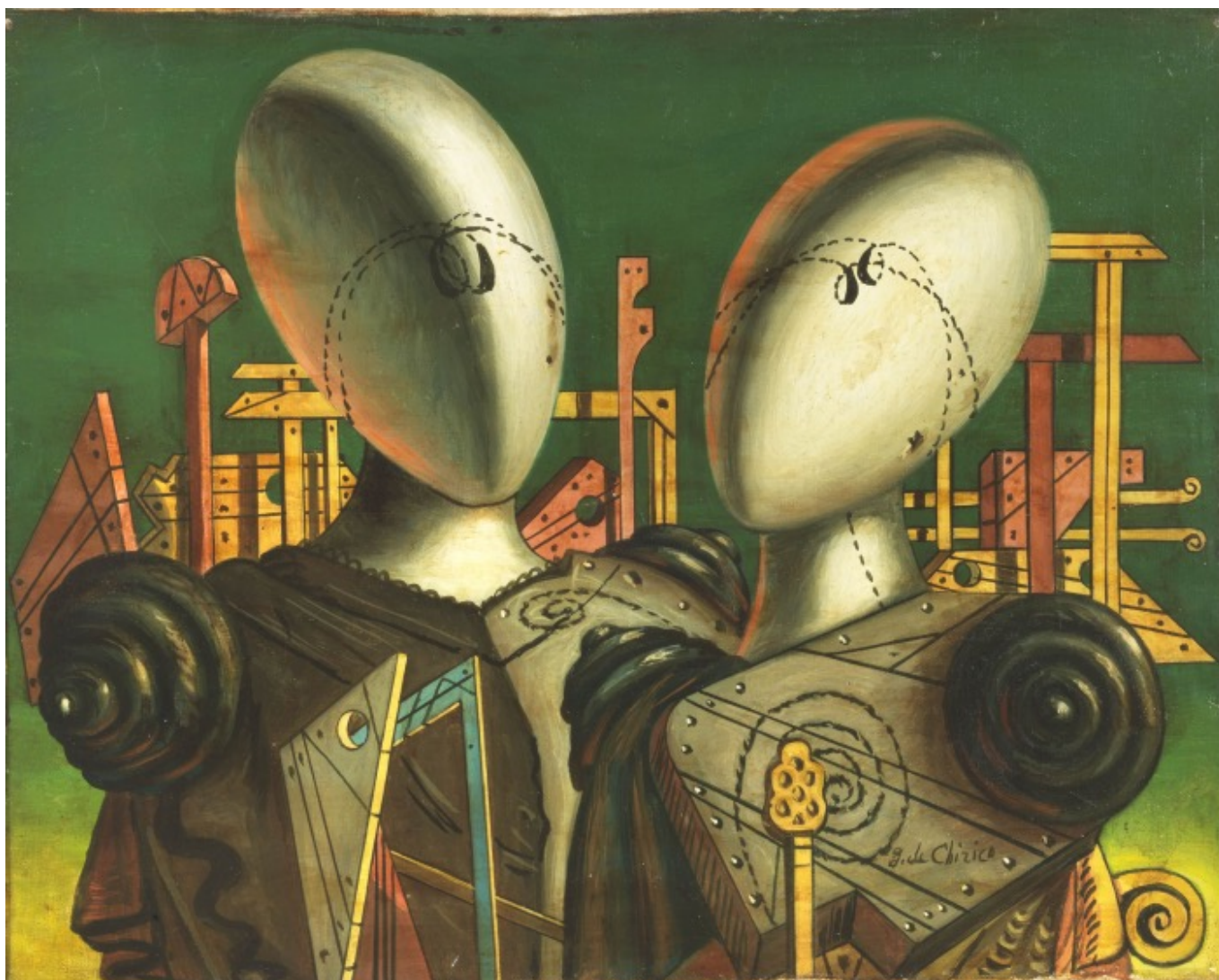
Giorgio de Chirico (Italia), Ettore e Andromaca , 1955-56.