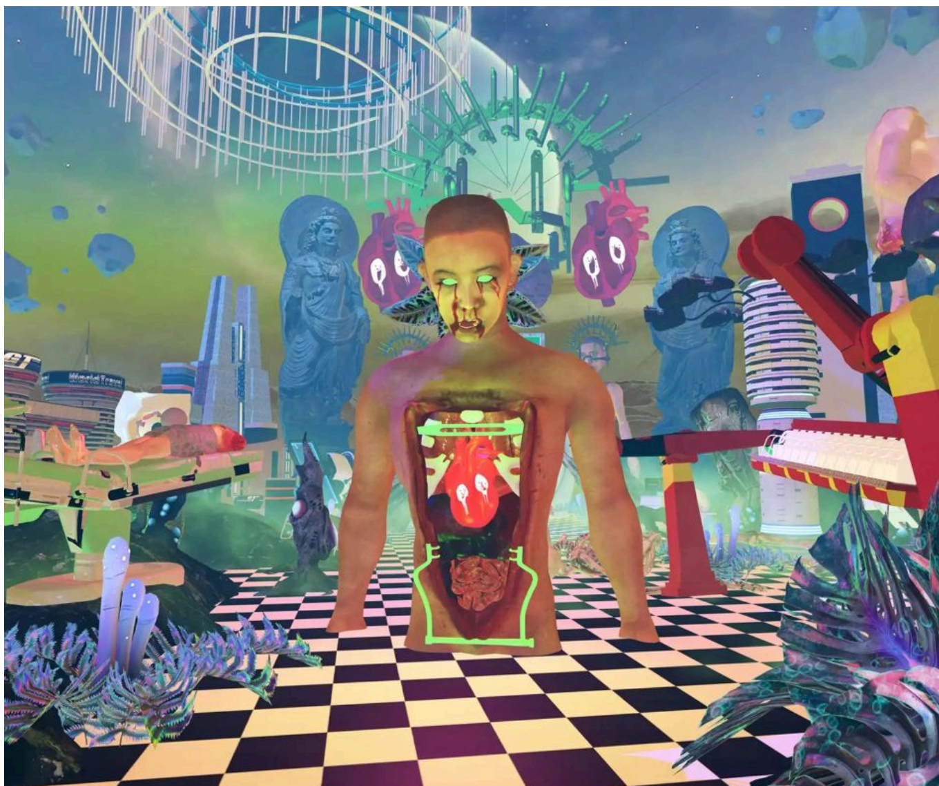
Lu Yang (China), Delusional World - Bardo #1 , 2021.