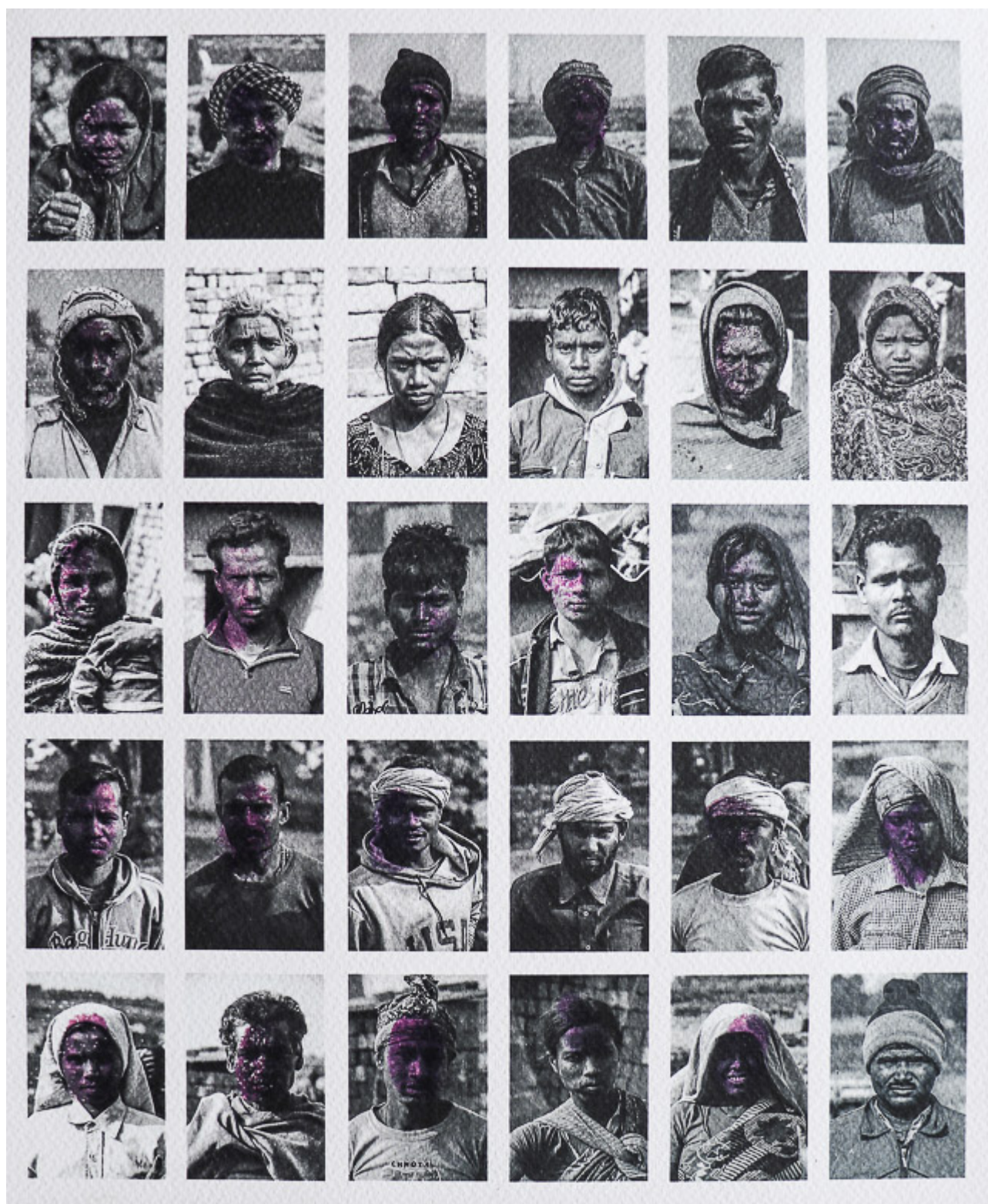
Birender Kumar Yadav (India), Erased Faces [Caras borradas], 2015.

Lo que encontramos en la India no es distinto de lo que ocurre en otras partes del mundo, con cada vez más trabajadoras y trabajadores sumidos en una precariedad creciente. Mientras que la pandemia aceleró el aumento del empleo informal y no regulado, la OIT ha demostrado a través de una serie de estudios