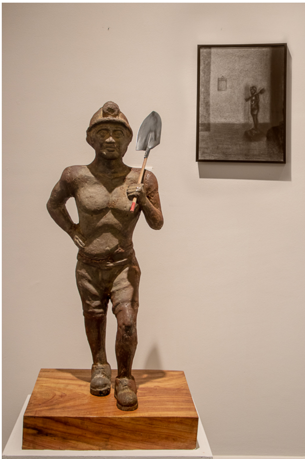
Birender Kumar Yadav (India), May Day [Día de las y los trabajadores], 2022.

Las ilustraciones de este boletín, extraídas de nuestro último dossier , son obra de Birender Kumar Yadav, artista multidisciplinar indio de Dhanbad, una ciudad de mineral de hierro y carbón construida sobre los hombros de mineros e indígenas. Gran parte de la obra de Yadav, inspirada en sus primeras experiencias como