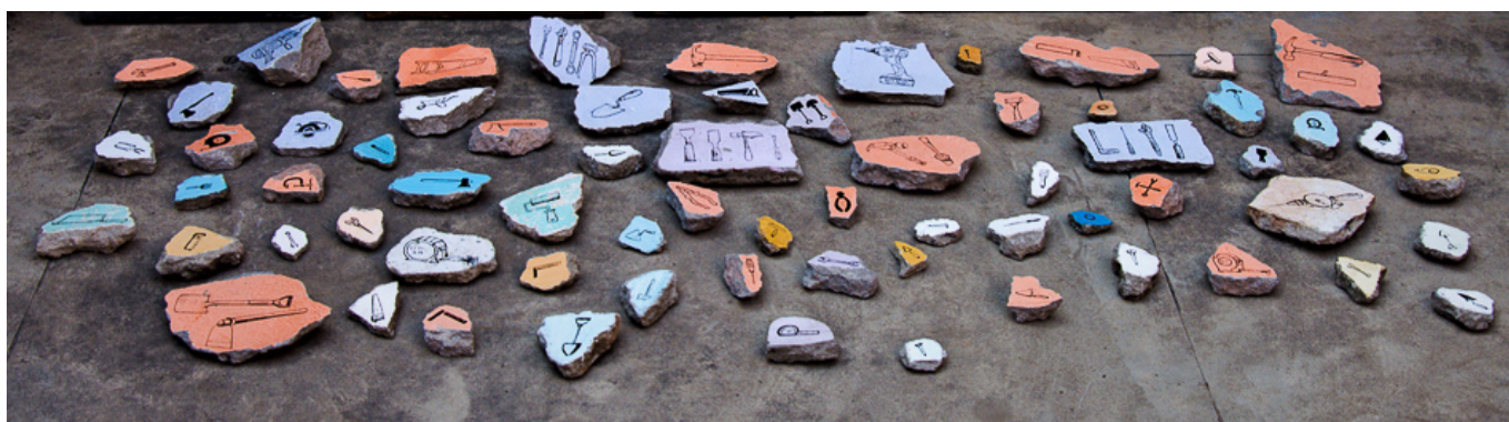
Detail of: Birender Kumar Yadav (India), Debris of Fate [Desechos del destino], 2015.