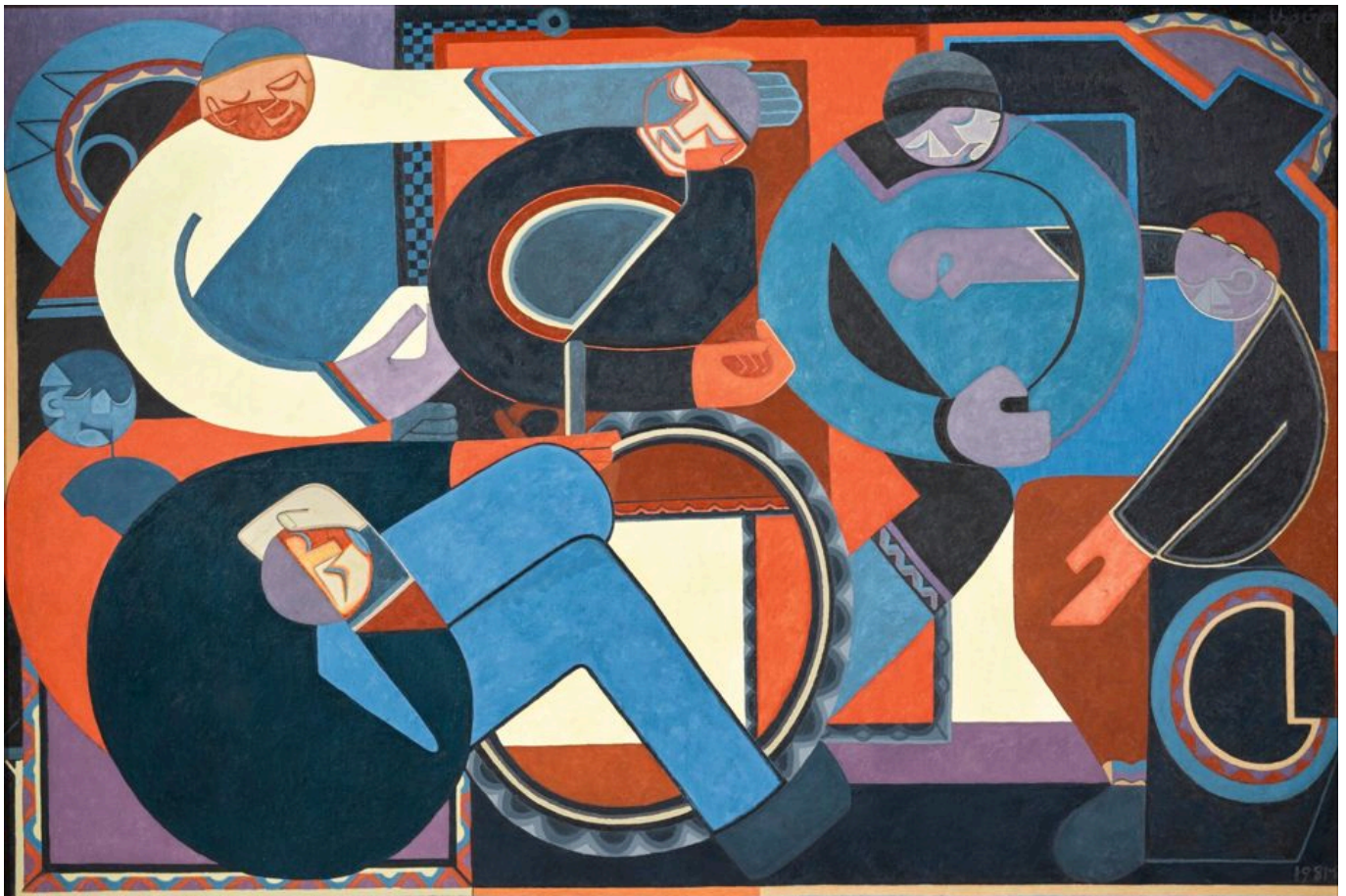
Uzo Egonu (Nigeria), Stateless People, An Assembly [Asamblea de personas sin Estado], 1982.

En estos países azotados por la crisis, la ayuda alimentaria procede de los gobiernos y del Programa Mundial de Alimentos (PMA) de la ONU. Millones de personas refugiadas en estos países dependen casi por completo de las agencias de la ONU. El PMA proporciona alimentos terapéuticos listos para usar, que son una pasta alimenticia hecha de mantequilla, cacahuetes, leche en polvo, azúcar, aceite vegetal y vitaminas. En los próximos seis meses, se prevé que el costo de estos ingredientes aumente hasta un 16%, por lo que el 20 de junio, el PMA anunció que reduciría las raciones en un 50%. Este recorte afectará a tres de cada cuatro refugiados en África Oriental, donde viven unos cinco millones de refugiados. «Ahora estamos viendo cómo el polvorín que ha creado las condiciones para que aumenten los niveles extremos de adelgazamiento pernicioso infantil comienza a incendiarse», dijo la Directora Ejecutiva de UNICEF, Catherine Russell.