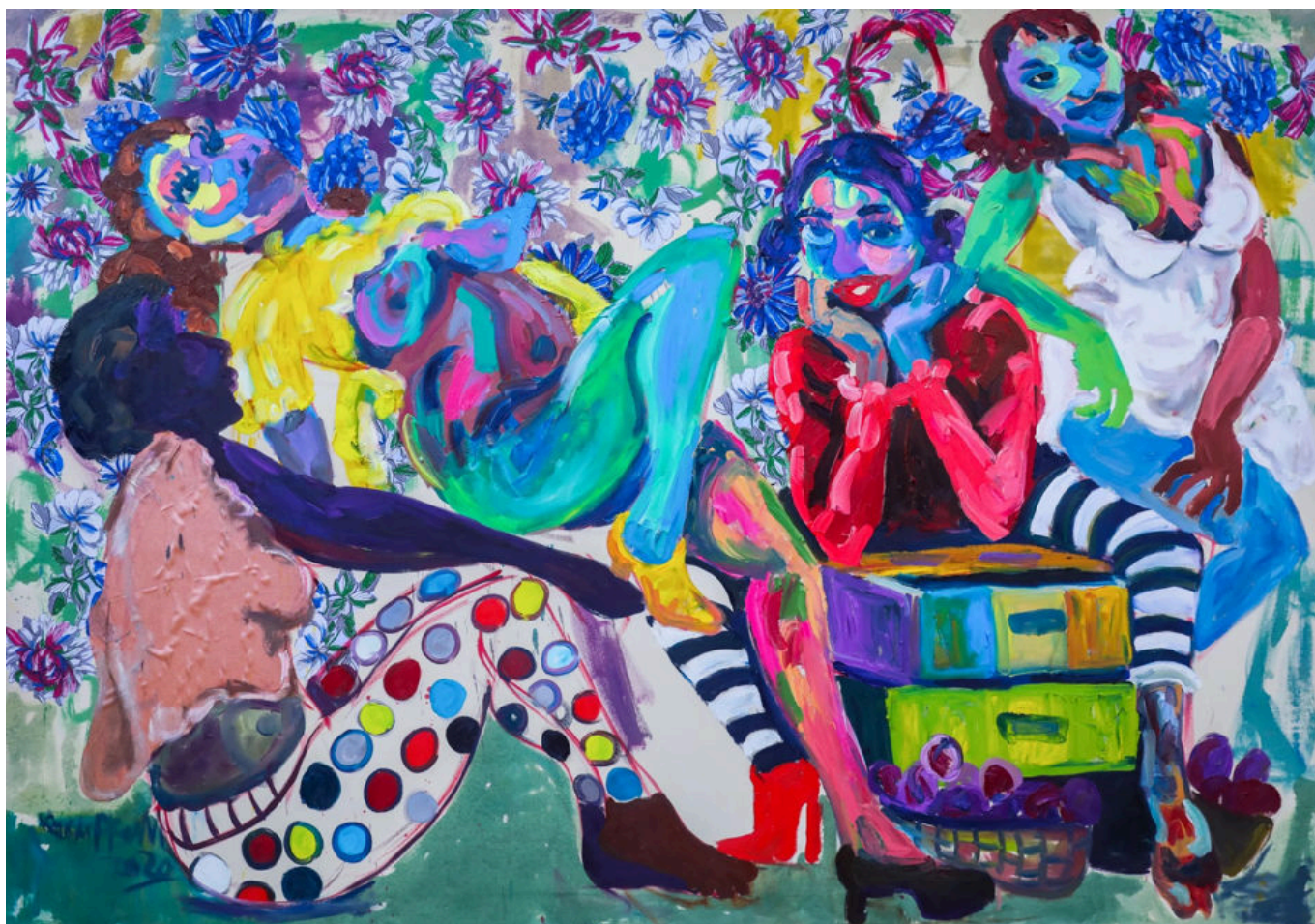
Wycliffe Mundopa (Zimbabwe), Easy Afternoon [Una tarde tranquila], 2020.

La forma en que se ha tratado a las y los profesores durante la pandemia demuestra la poca importancia que se da a este trabajo crucial y a la educación en general en nuestra sociedad global. Solo en 19 países se colocó a lxs profesores en el primer grupo de prioridad con lxs trabajadores de primera línea para recibir la vacuna COVID-19.