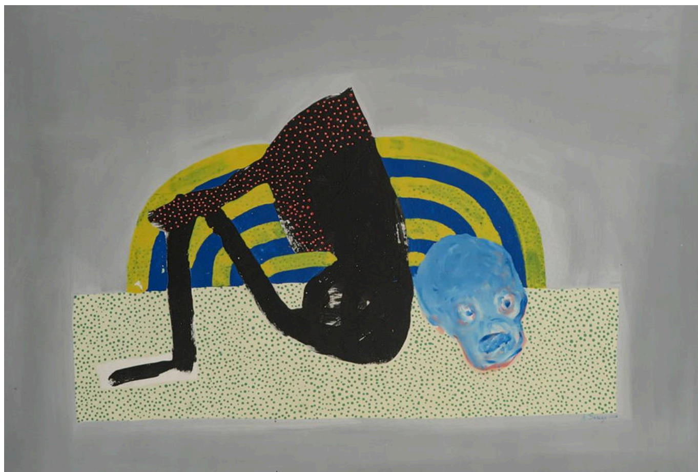
Amadou Sanogo (Mali), Je pense de ma tête [Pienso con la cabeza], 2016.