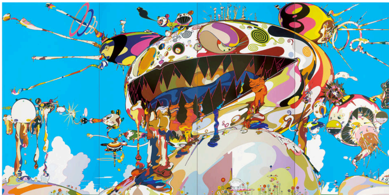
Takashi Murakami (Japón), Tan Tan Bo Puking - a.k.a. Gero Tan, 2002.