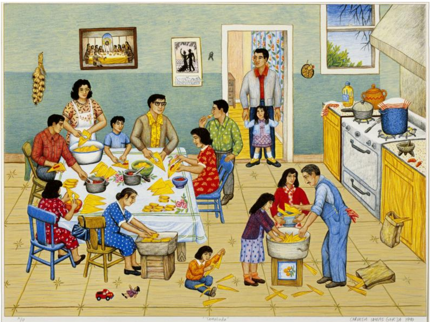
Carmen Lomas Garza (EE. UU.), Tamalada , 1990.

Estos enormes paquetes económicos de EE.UU. se generaron para poner dinero en manos de las y los consumidores. El gobierno se centró en la demanda de la economía poniendo dinero en circulación para el consumo, pero no aumentó el gasto en la oferta de la economía poniendo dinero en la inversión. Entre 2019 y 21, el 98% del crecimiento del PIB estadounidense correspondió al consumo, mientras que solo el 2% correspondió a la inversión neta. Con un gran aumento de la demanda por parte de los consumidores y un aumento casi nulo de la oferta, se produjo una enorme ola inflacionaria en Estados Unidos.