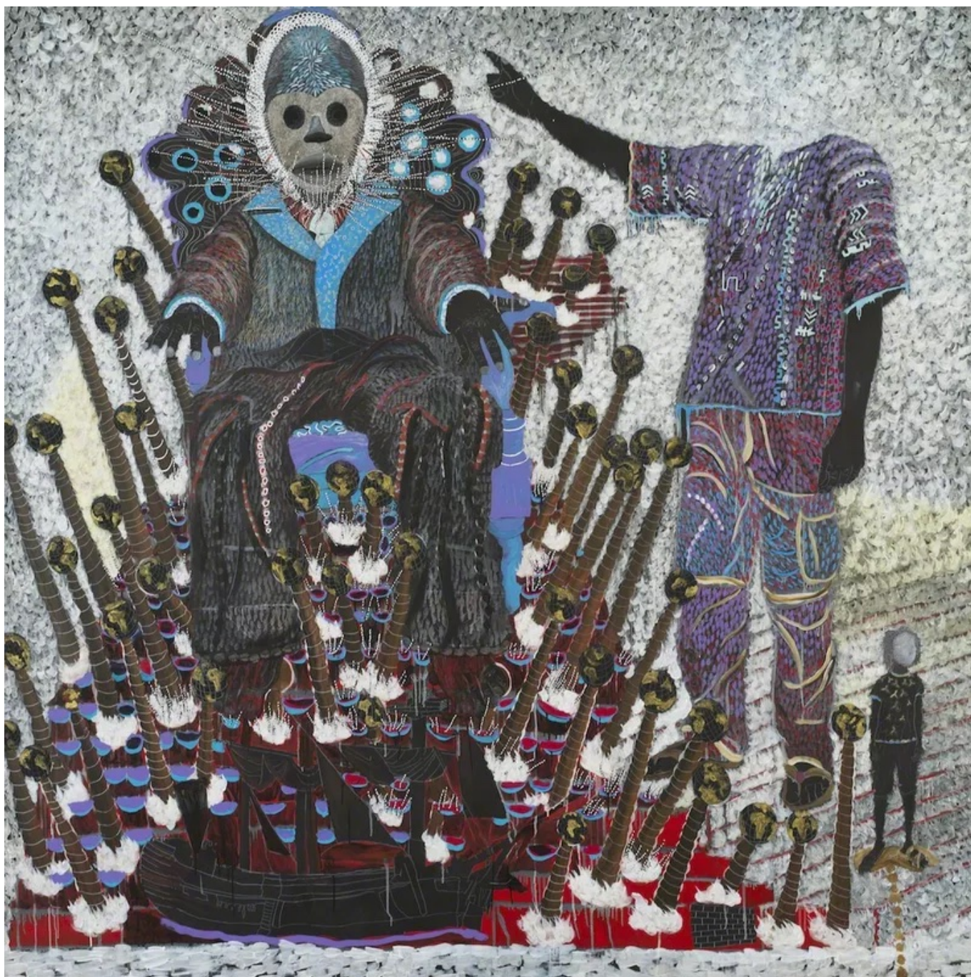
Omar Ba (Senegal), Promenade masquée 2 [Marcha enmascarada 2] , 2016.

En 2005, el entonces secretario general de la ONU, Kofi Annan, escribió un informe titulado Un concepto más amplio de libertad en el que pedía la ampliación del CSNU de 15 a 24 miembros. Esta ampliación, decía, debe hacerse sobre una base regional, en lugar de asignar los puestos permanentes según ejes históricos de poder (como con los Cinco Grandes). Uno de los modelos propuestos por Annan preveía dos puestos permanentes para África, dos para Asia y el Pacífico, uno para Europa y uno para América. Este reparto representaría más fielmente la distribución regional de la población mundial, con el centro de gravedad del CSNU desplazándose hacia los continentes más poblados de África (1.400 millones de habitantes) y Asia (4.700 millones) y alejándose de Europa (742 millones) y América (1.000 millones).