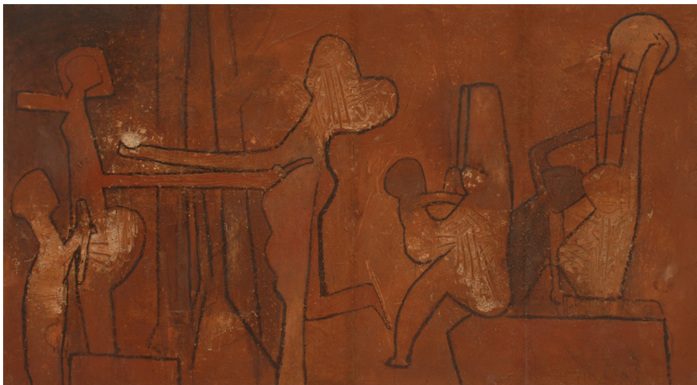
Roberto Matta (Chile), Cuba es la capital , 1963.