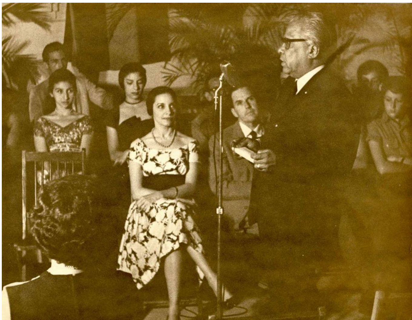
Nicolás Guillén rinde honores a Alicia Alonso en la Unión Nacional de Escritores y Artistas de Cuba, La Habana, 1961.

En los primeros años después de 1959, Cuba se convulsionó con estos brotes de creatividad y experimentación. Nicolás Guillén (1902-1969), un gran poeta revolucionario que había sido encarcelado durante la dictadura de Fulgencio Batista, captó la dureza de la vida y el gran deseo de que el proceso revolucionario emancipara al pueblo cubano de la miseria del hambre y las jerarquías sociales. Su poema “Tengo”, de 1964, nos dice que la nueva cultura de la revolución era elemental: la sensación de no tener que inclinar los hombros ante un superior, de decir a las y los trabajadores en las oficinas que ellos también son compañeros y no “señor” y “señora”, de entrar como negro en un hotel sin que te digan que te detengas en la puerta. Su gran poema anticolonial nos alerta sobre los fundamentos materiales de la cultura: