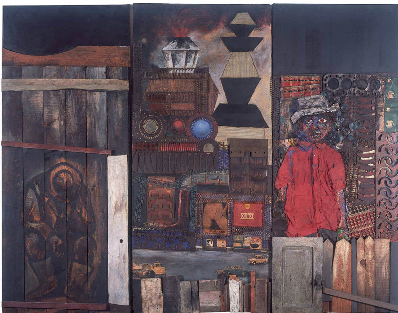
Antonio Berni (Argentina), Juanito Laguna, s/f .

Tesis nueve: La batalla de emociones. Fidel Castro provocó un debate en la década de 1990 alrededor del concepto de la Batalla de ideas, la lucha de clases en el pensamiento contra las banalidades de las concepciones neoliberales de la vida humana. En los discursos de Fidel de este periodo no solo era clave lo que decía, sino cómo lo decía, con cada palabra impregnada de la gran compasión de un hombre comprometido con la liberación de la humanidad de los tentáculos de la propiedad, el privilegio y el poder. De hecho, la Batalla de ideas no se refería únicamente a las ideas en sí, sino también a una “batalla de emociones”, un intento de cambiar la gama de emociones de una fijación en la codicia a consideraciones de empatía y esperanza.