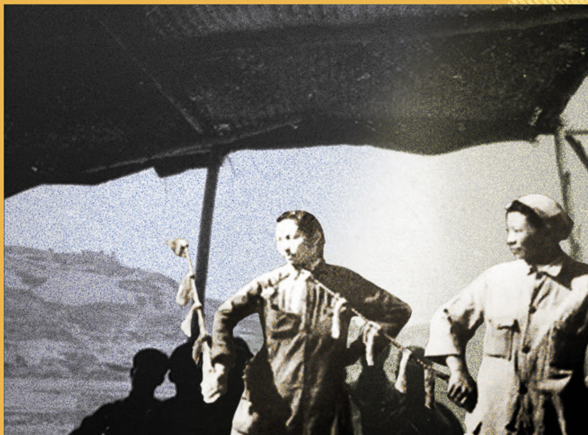
En primer plano: Actores de una compañía de ópera de Beijing. Atrás: Los estudiantes de arte dramático de la Academia de Artes Lu Xun ensayan una obra en una estructura construida por ellos mismos.