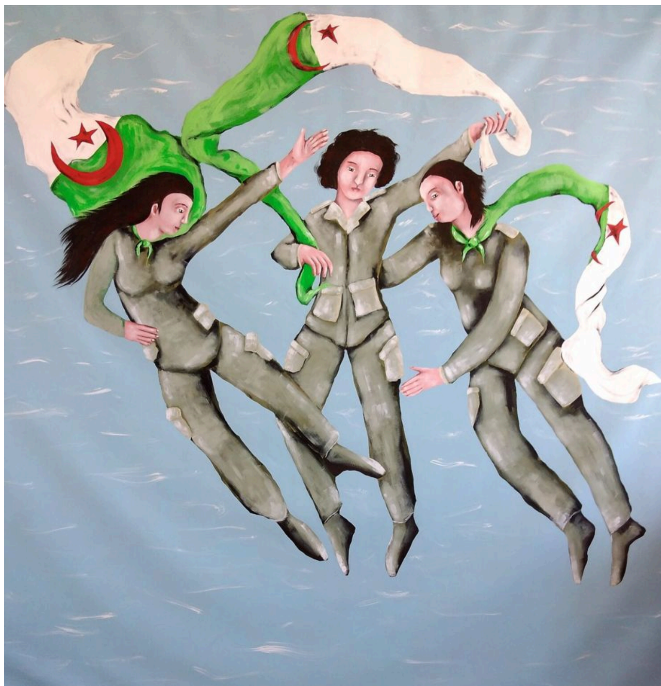
El Meya (Argelia), Les Moudjahidates , 2021.

En cuarto lugar, analizamos la aparición de nuevas organizaciones asentadas en el Sur Global, como la Organización de Cooperación de Shanghái (2001), los BRICS10 (2009) y el Grupo de Amigos en Defensa de la Carta de la ONU (2021). Estas plataformas interregionales se encuentran en una fase embrionaria, pero evidencian el crecimiento de un nuevo regionalismo y multilateralismo. Aunque estas formaciones no pretenden operar como un bloque para contrarrestar el bloque del Norte Global, reflejan lo que anteriormente