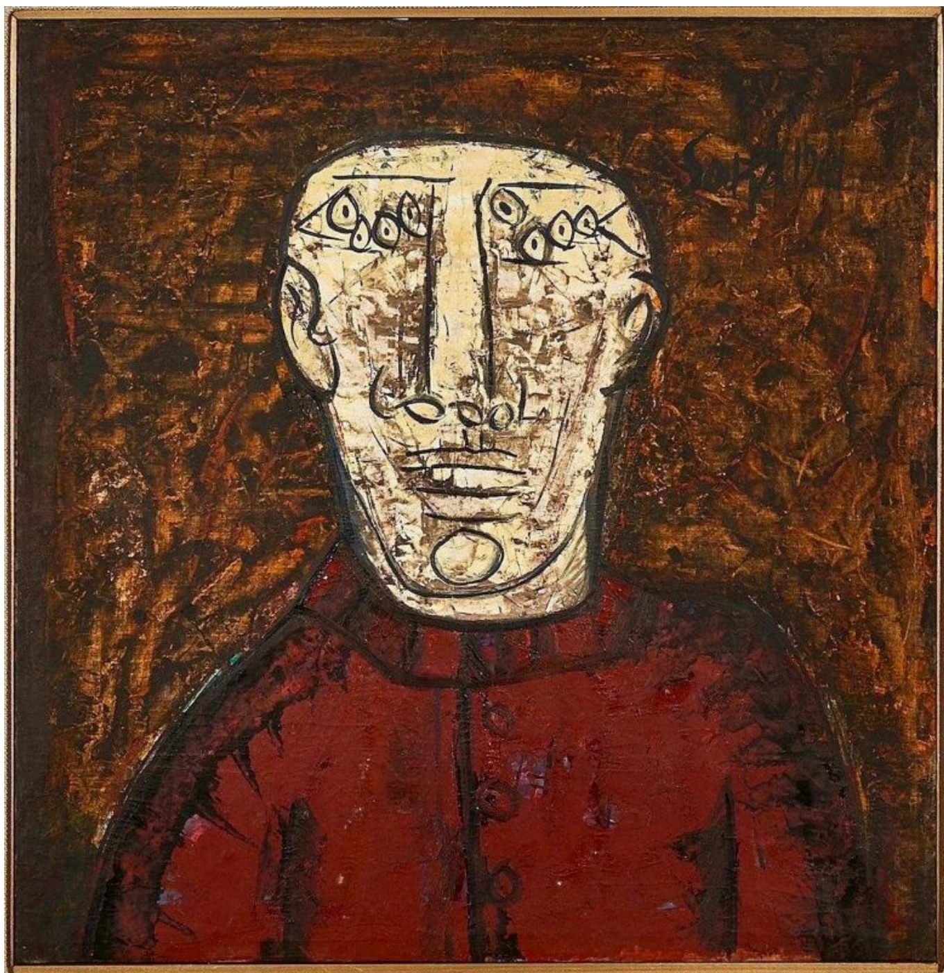
Francis Newton Souza (India), The Foreman [El capataz] , 1961.

Los movimientos populares de todo el mundo surgen de las ganas y las esperanzas de las y los trabajadores y campesinos, de personas explotadas para que unos pocos acumulen capital y oprimidas por jerarquías sociales. Si suficientes personas se niegan a someterse a los hechos persistentes del hambre y el analfabetismo, sus acciones podrían convertirse en una rebelión, o incluso en una revolución. Esa negativa a someterse requiere claridad y confianza.