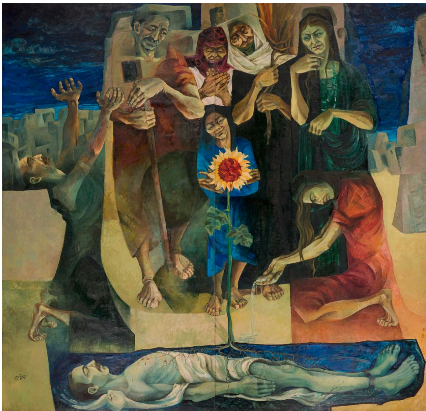
Ayoub Emdadian (Irán), The Sapling of Liberty [El retoño de la libertad], 1973.

En mayo de 2024, la magnitud de la brutalidad de Israel en Gaza obligó finalmente a la CPI a ocuparse de la cuestión. Las órdenes de la CIJ, la indignación expresada por numerosos gobiernos del Sur Global y las creciente ola de protestas en un país tras otro motivaron conjuntamente a la CPI a actuar. El 20 de mayo, Khan celebró una rueda de prensa en la que dijo que había presentado solicitudes de detención contra los dirigentes de Hamás Yahya Sinwar, Mohammed Diab Ibrahim al-Masri e Ismail Haniyeh y contra el primer ministro israelí Netanyahu y su jefe militar, Yoav Gallant. El fiscal general de Israel, Gali Baharav-Miara, afirmó que las acusaciones de la CPI contra Netanyahu y Gallant “carecen de fundamento” y que Israel no acatará ninguna orden de la CPI. Desde hace décadas, Israel —al igual que EE. UU.— rechaza cualquier intento de aplicar el derecho internacional humanitario a sus acciones. El “ orden internacional basado en reglas ” siempre ha proporcionado inmunidad a Estados Unidos y a sus aliados cercanos, una inmunidad cuya