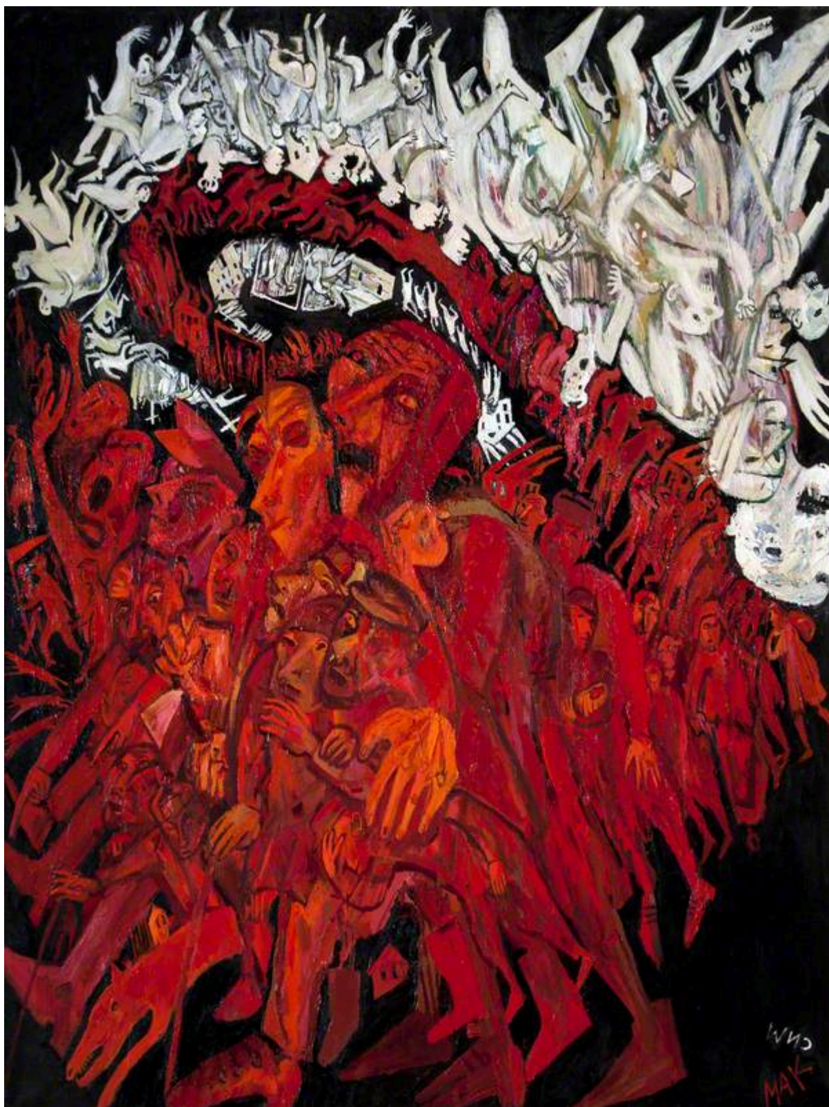
Maxim Kantor (Rusia), Two Versions of History [Dos versiones de la historia], 1993.