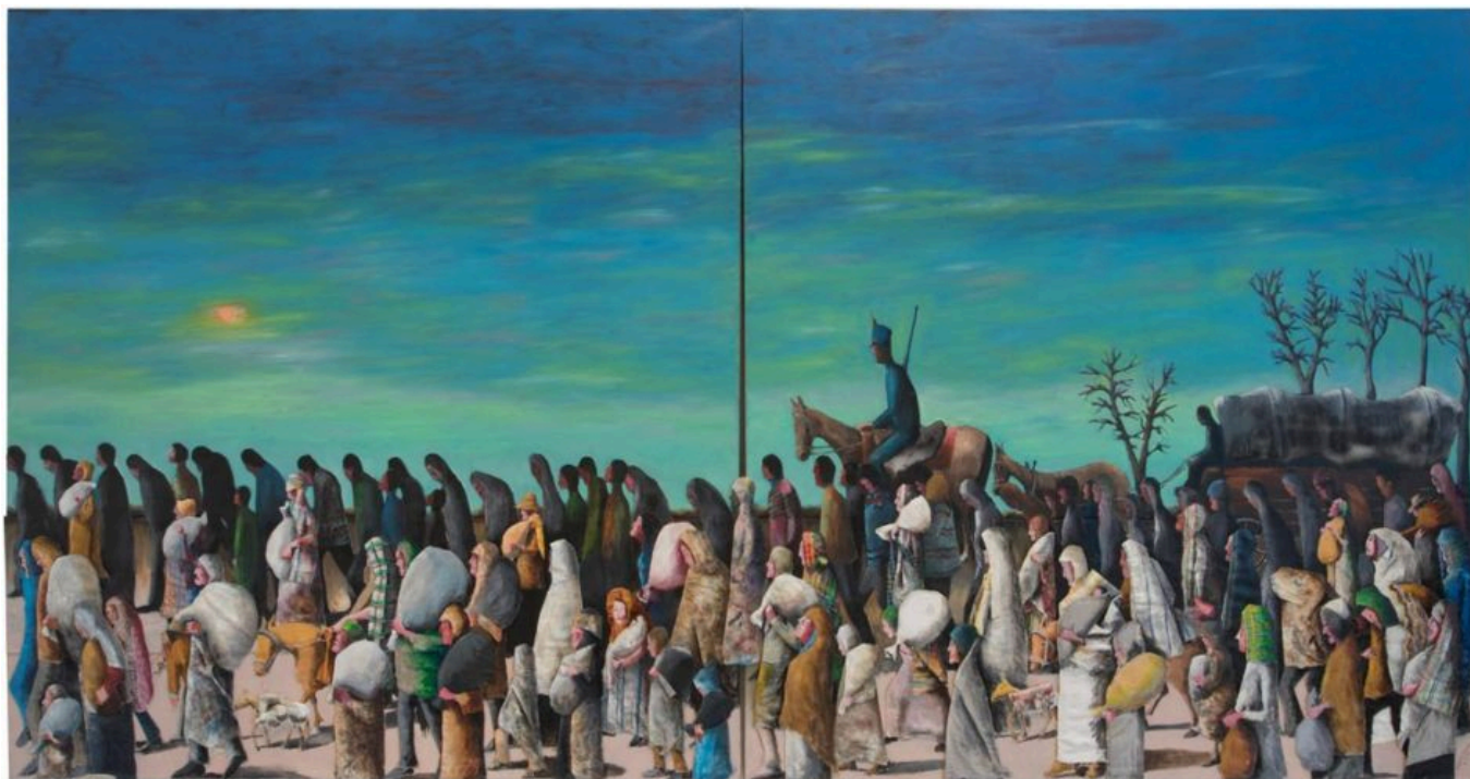
Benny Andrews (EE. UU.), Trail of Tears [Camino de lágrimas], 2005.

En El libro de los abrazos (1992), nuestro amigo Eduardo Galeano escribió un breve fragmento sobre las graves divisiones que afligen a nuestro mundo y clavan una fría estaca de hierro en el corazón de nuestro sentido de la humanidad. Ese fragmento se titula “Los nadies”: