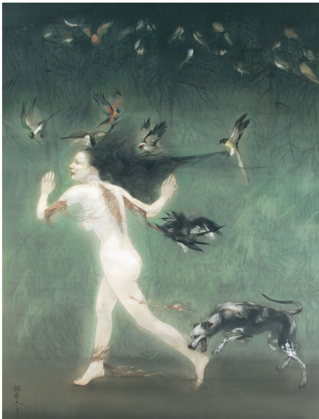
Fuyuko Matsui (Japón), Scattered Deformities in the End [Deformidades dispersas en el final], 2007.

pueblo”. El veto de Thomas-Greenfield no surgió de la nada.