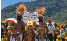
Personas de la tribu Mursi en un momento de su discurso.

El informe de las 10 compañías mineras de Canadá, publicado por el Instituto de Investigación Social Tricontinental, muestra que el 40% de las compañías mineras del mundo tienen su sede en Canadá, y que la mayoría de las compañías mineras están vinculadas a compañías mineras canadienses y estadounidenses.