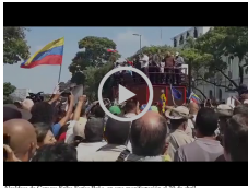
Activistas de Argentina pidiendo justicia en un momento de su discurso.

¿Qué es el derecho a la justicia? ¿Qué es el derecho a la verdad? ¿Qué es el derecho a la memoria? ¿Qué es el derecho a la reparación? ¿Qué es el derecho a la justicia? ¿Qué es el derecho a la verdad? ¿Qué es el derecho a la memoria? ¿Qué es el derecho a la reparación?