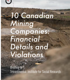
10 Canadian Mining Companies: Financial Details and Violations.

Una de las últimas imágenes de Miguel Rivera, un activista opositor de Venezuela, fue tomada el 18 de junio de 2019, en un momento de su discurso. Él fue uno de los líderes de la resistencia en Venezuela.