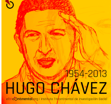
Hugo Chávez, fallecido el 5 de marzo de 2013.

Los subproductos de la Real Academia de la Lengua, publicados por el Instituto de Investigación Social Tricontinental, muestran que el 40% de las compañías mineras del mundo tienen su sede en Canadá, y que la mayoría de las compañías mineras están vinculadas a compañías mineras canadienses y estadounidenses.