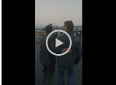
Activistas de Argentina pidiendo justicia en un momento de su discurso.

¿Qué es el derecho a la justicia? ¿Qué es el derecho a la verdad? ¿Qué es el derecho a la memoria? ¿Qué es el derecho a la reparación? ¿Qué es el derecho a la justicia? ¿Qué es el derecho a la verdad? ¿Qué es el derecho a la memoria? ¿Qué es el derecho a la reparación?