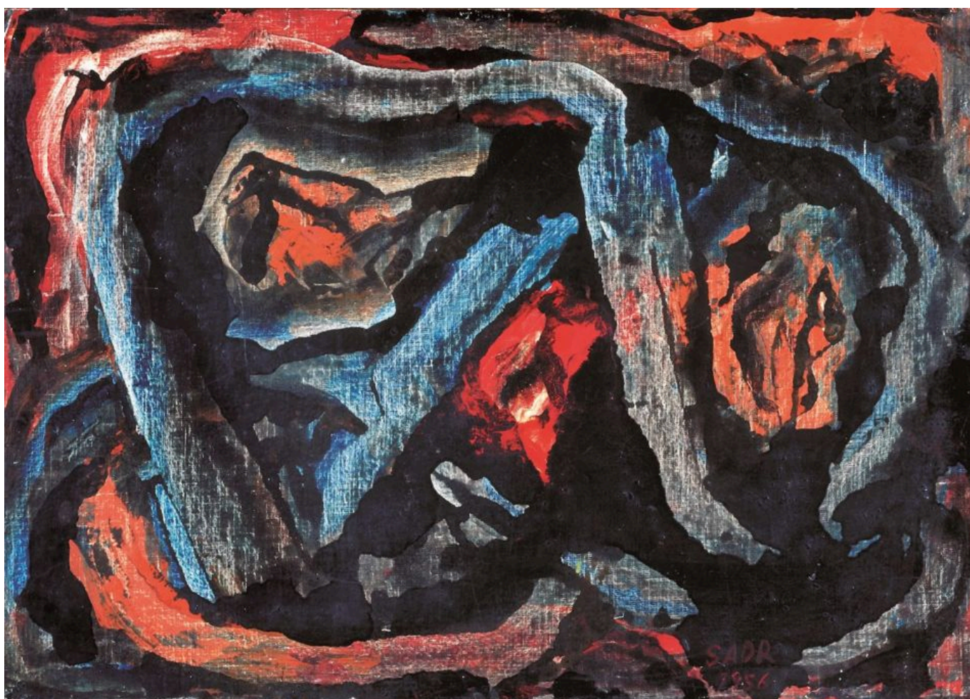
Behjat Sadr (Irán), Sin título , 1955.

aunque este análisis reconoce la sensación de duda que invade el planeta, no ofrece nada que se parezca a una explicación de la aparición de la policrisis y, por tanto, deja a miles de millones de personas sin un análisis de lo que está causando estas múltiples crisis y de cómo podemos trabajar en conjunto para salir de ellas. En aquel discurso de 2016, Juncker, desde la perspectiva de la derecha cristiana europea, dijo que la nueva propuesta de la Unión Europea para Europa, pero no para el globo, consistía en movilizar la inversión para construir infraestructura y mejorar las condiciones generales de la vida cotidiana en lugar de crear un “mundo de austeridad ciega y estúpida con el que muchos siguen fantaseando”. Pero no surgió tal proyecto. “Europa se está recuperando”, dijo entonces. Pero ahora, como Peter Mertens —secretario general del Partido de los Trabajadores de Bélgica— me dijo a principios de este año, “el consenso neoliberal” sigue asfixiando a Europa y ha sumido al continente en una desesperación provocada por la inflación que —por ahora— favorece a la derecha dura.