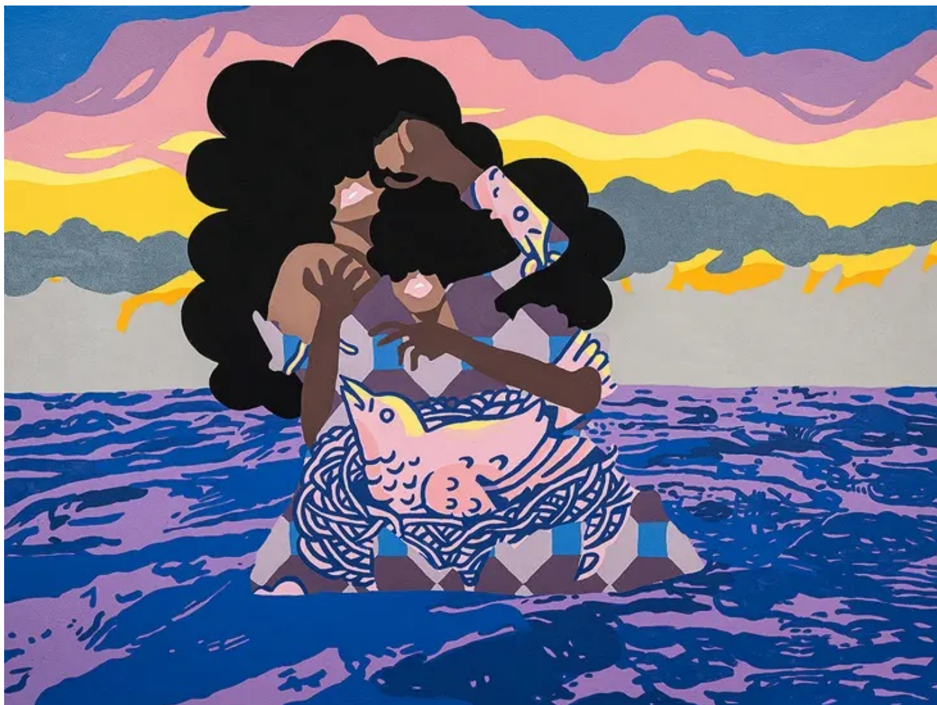
Sheena Rose (Barbados), Agony [Agonía], 2022.

Hace doscientos años, las fuerzas de Simón Bolívar derrotaron al Imperio español en la Batalla de Carabobo de 1821 y abrieron un periodo de independencia para América Latina. Dos años más tarde, en 1823, el gobierno estadounidense anunciaba su Doctrina Monroe. La dialéctica entre Carabobo y Monroe sigue dando forma a nuestro mundo, con la memoria de Bolívar impregnada en la esperanza y la lucha por una sociedad más justa.