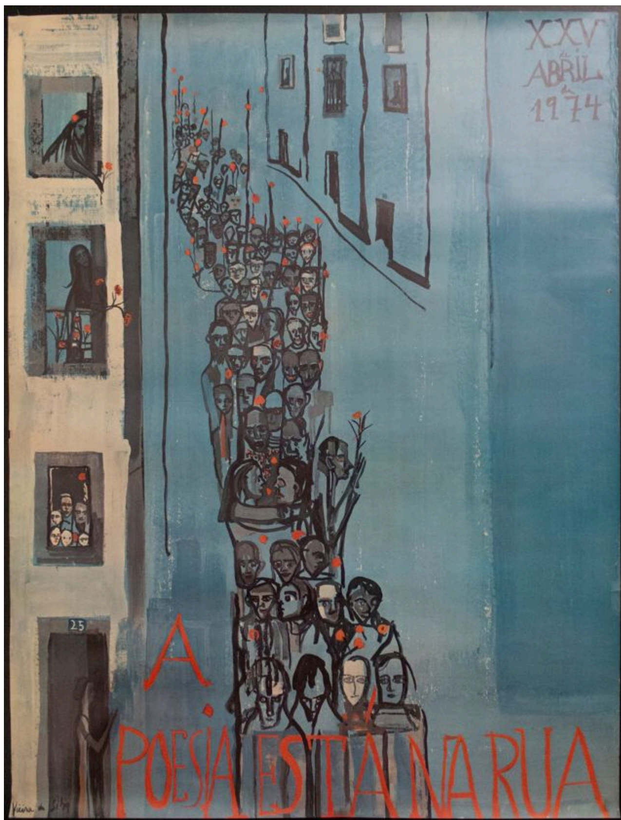
Maria Helena Vieira da Silva (Portugal), La poesía está en la calle I , 1974.