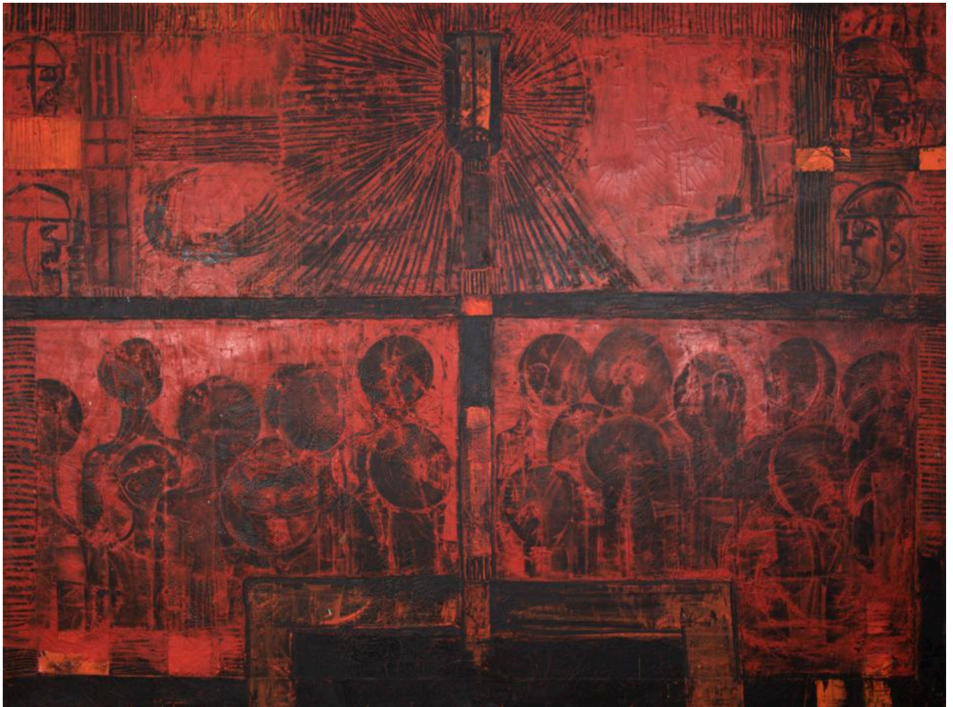
Bertina Lopes (Mozambique), Homenaje a Amílcar Cabral , 1973.

Amílcar Cabral (1924-1973), que nació hace cien años este septiembre y que hizo más que muchos para construir las formaciones africanas contra el colonialismo del Estado Novo, no vivió para ver la independencia de las colonias africanas de Portugal. En la Conferencia Tricontinental de 1966, celebrada en La Habana (Cuba), Cabral advirtió que no bastaba con deshacerse del antiguo régimen, y que aún más difícil que derrocarlo sería construir el nuevo mundo a partir del antiguo, de Portugal a Angola, de Cabo Verde a Guinea-Bissau, de Mozambique a Santo Tomé y Príncipe. La lucha principal después de la descolonización, dijo Cabral, es la “lucha contra nuestras propias debilidades”. Esta “batalla contra nosotros mismos”, continuó, “es la más difícil de todas” porque es una batalla contra las “contradicciones internas” de nuestras sociedades, la pobreza heredada del colonialismo y las miserables jerarquías de nuestras complejas formaciones culturales.