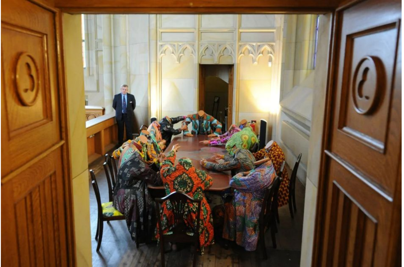
Yinka Shonibare (Nigeria), Scramble for Africa [La disputa por África], 2003.

es el símbolo de su subordinación política a Washington.