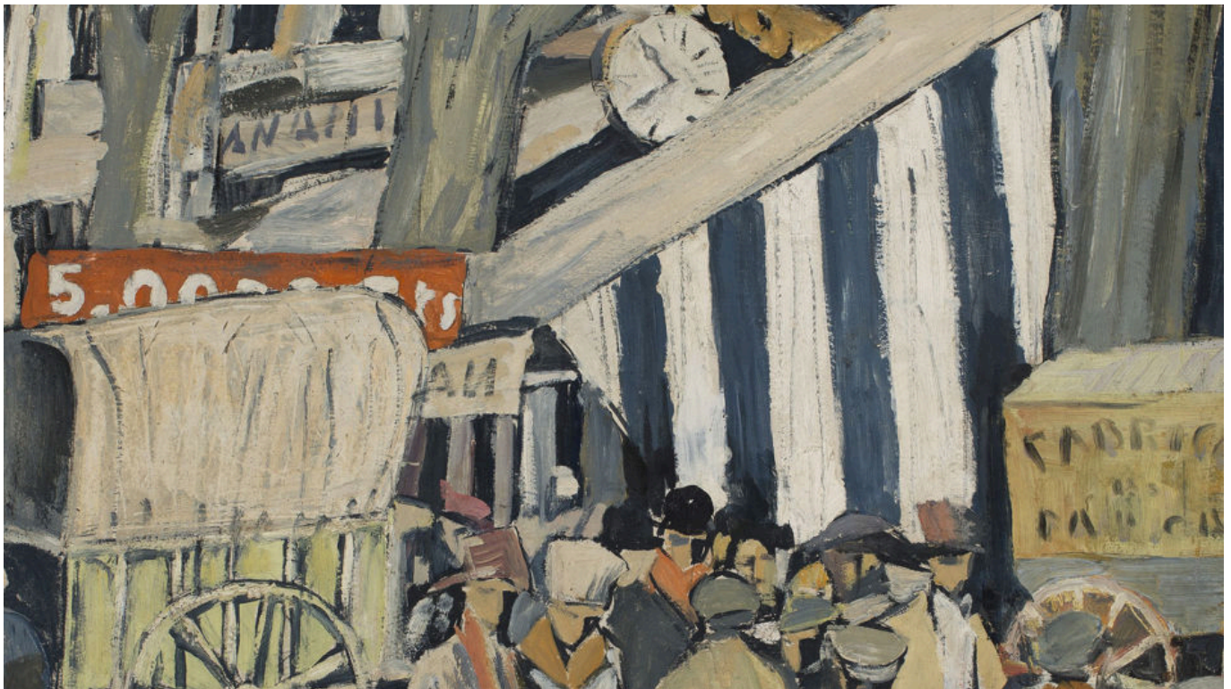
Joaquín Torres-García (Uruguay), Entoldado (La Feria) , 1917.

Las divisiones políticas y culturales que se ensancharon durante los años de Trump siguen teniendo un alto costo en la sociedad estadounidense, incluso sobre la capacidad del gobierno para controlar la pandemia de COVID-19. Los protocolos básicos para evitar las infecciones no se siguen universalmente. La desinformación relacionada con el COVID-19 se ha extendido tan rápidamente como el virus en EE. UU., donde un gran número de personas cree en afirmaciones sensacionalistas: por ejemplo, que las mujeres embarazadas no deben ponerse la vacuna, que la vacuna promueve la infertilidad y que el gobierno oculta los datos sobre las muertes causadas por las vacunas.