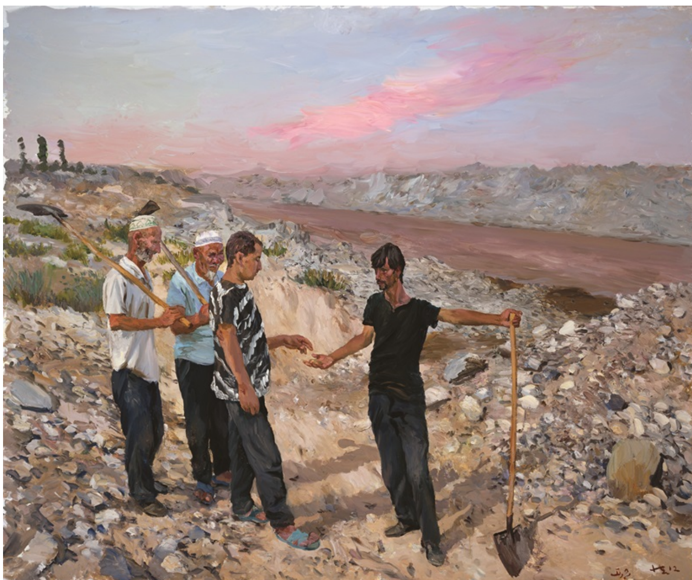
Liu Xiaodong (China), East [El Este] , 2012.

Dentro de China, la visita de Xi a Rusia fue ampliamente debatida con un sentimiento general de orgullo por el hecho de que el gobierno chino esté asumiendo el liderazgo tanto para bloquear las ambiciones de Occidente como para buscar la paz en el conflicto. Estos debates, reflejados en diarios y en plataformas de medios sociales como WeChat, Douyin, Weibo, LittleRedBook, Bilibili y Zhihu, resaltaron cómo China, un país en vías de desarrollo, ha sido capaz, no obstante, de superar sus limitaciones y asumir una posición de liderazgo en el mundo.